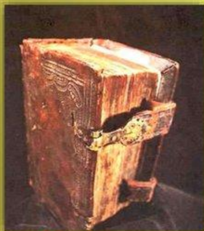
Книги из пергамента