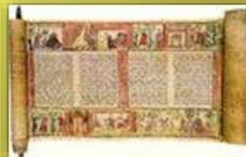
Книги - свитки