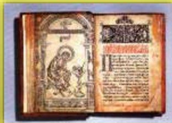
Первые печатные книги