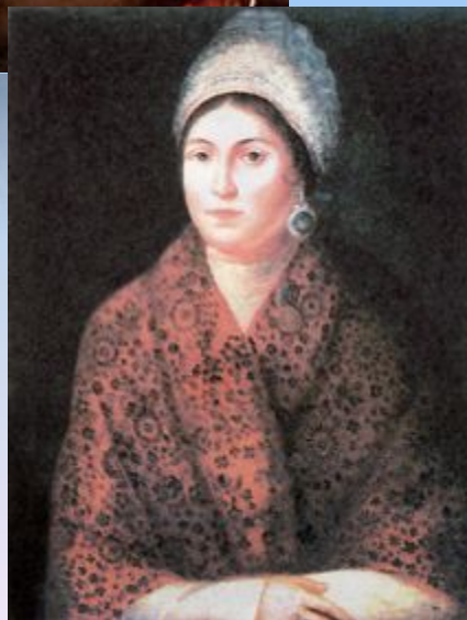
1767—1823 указаний, с. 100-101