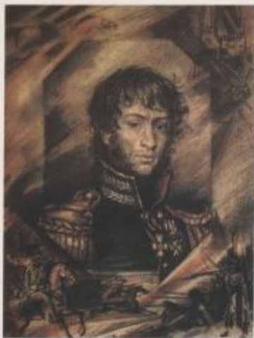
Александр Суворова Фигнер 1767—1823