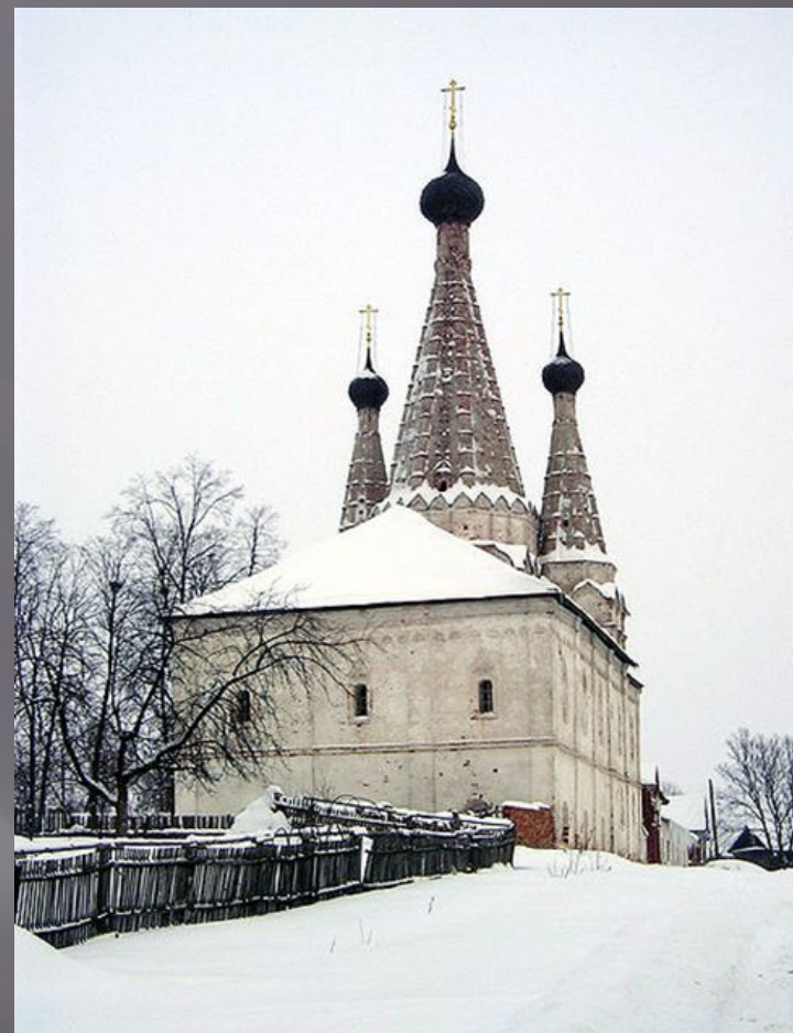
Успенская Дивная церковь на территории Алексеевского монастыря в Угличе.

Последним храмом шатрового типа является московская церковь Рождения Богородицы в Путинках, относящаяся к середине 17 века. Дело в том, что как раз в этот период церковь во главе с патриархом Никоном признала многие старые церковные догмы ошибочными, и на строительство шатровых соборов и церквей был наложен запрет. Отныне они должны были быть непременно пятиглавыми и с маковками.