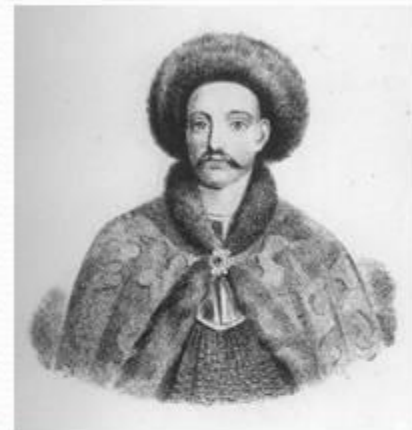
Всеволод(княжил в Переяславле и в Ростово- Суздальской земле)