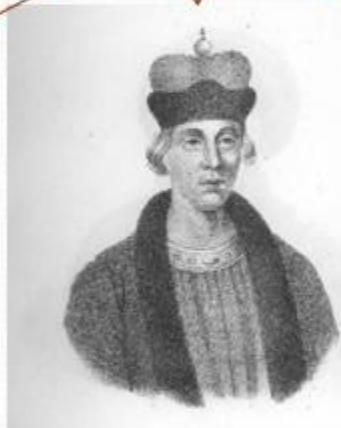
Святослав(княжил в Чернигове и в землях по Десне и Оке до Мурома)