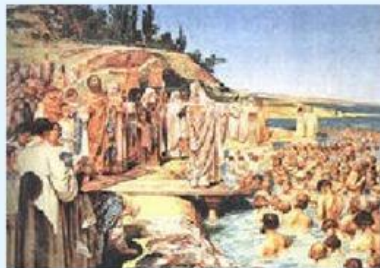
Крещение славян в водах Днепра