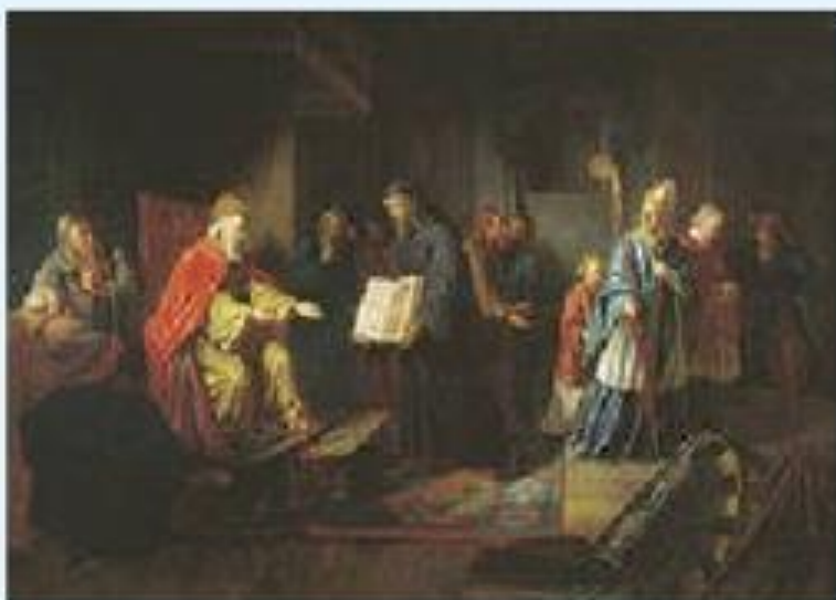
Князь Владимир выбирает религию