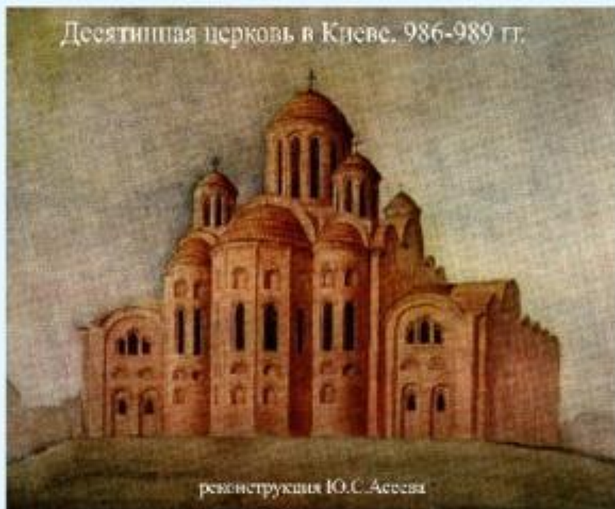
реконструкция Ю.С. Асеева