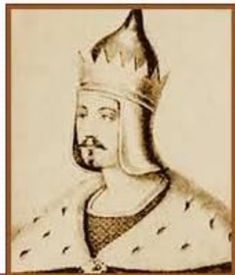
Изяслав(княжил в Киеве и Новгороде)