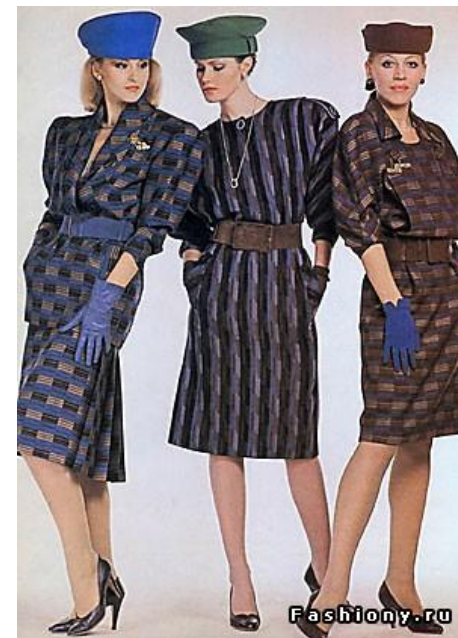
1990-2000. В моду плотно входит минимализм