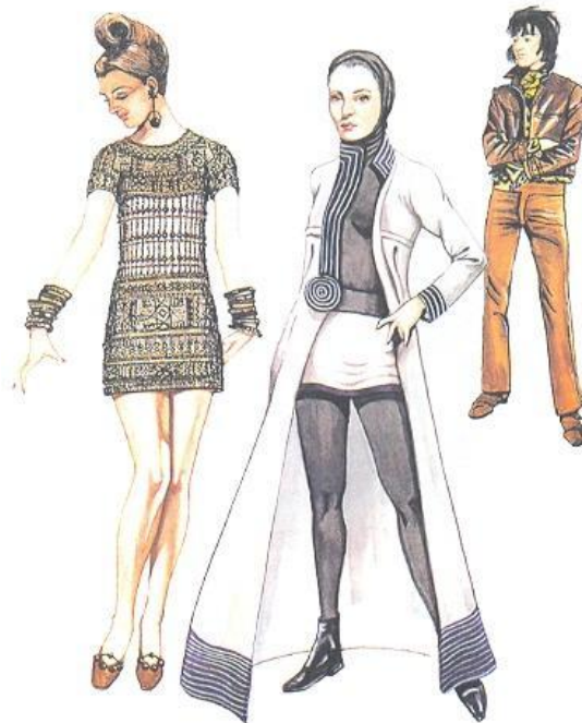
Мужской и женский стиль 1969 год