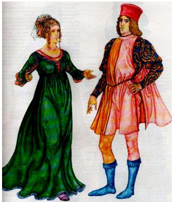
Костюм эпохи Возрождения Италия