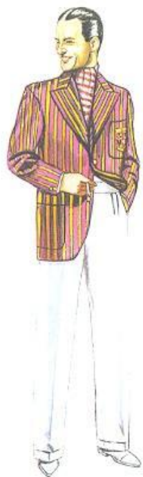
Одежда для прогулок 1934 год