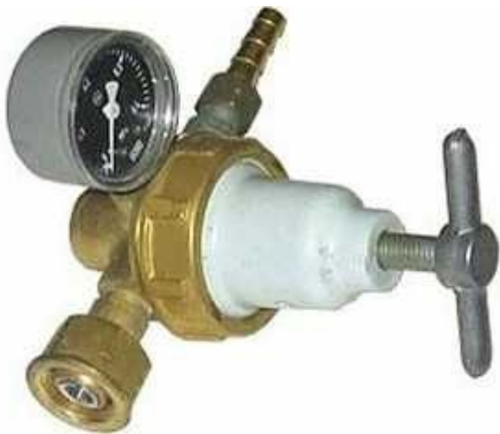
Редуктор ацетиленовый сетевой

По назначению и месту установки редукторы подразделяют на баллонные (Б), рамповые (Р), сетевые (С), универсальные высокого давления (У)