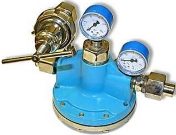
Редуктор кислородный рамповый

При газовой сварке и резке металлов рабочее давление газов должно быть меньше, чем давление в баллоне или газопроводе. Для понижения давления газа применяют редукторы.