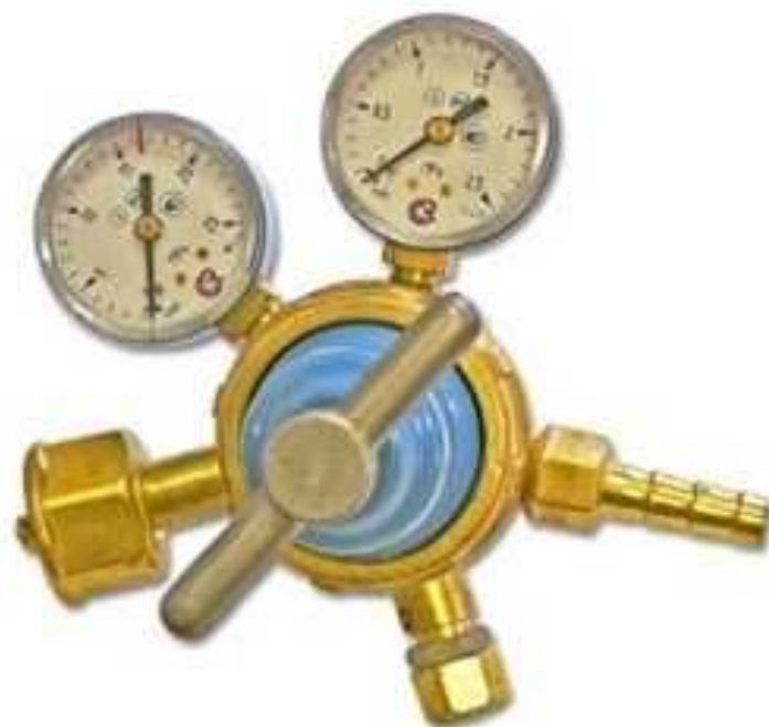
Редуктор кислородный баллонный