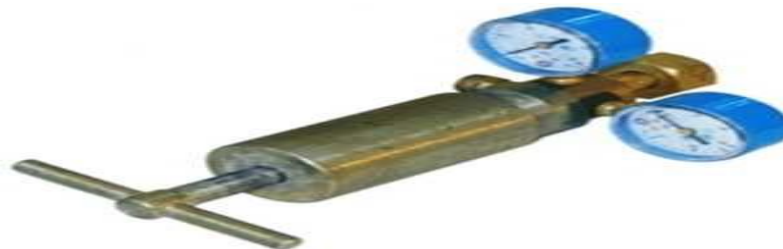
Редуктор высокого давления

Редукторы для горючих газов (метан, водород) имеют левую резьбу, чтобы предотвратить случайное подсоединение редуктора, работавшего с горючими газами, к кислородному баллону. Баллоны с инертными газами (гелий, азот, аргон) имеют правую резьбу, как и баллоны с кислородом. Таким образом, для инертных газов могут использоваться кислородные редукторы