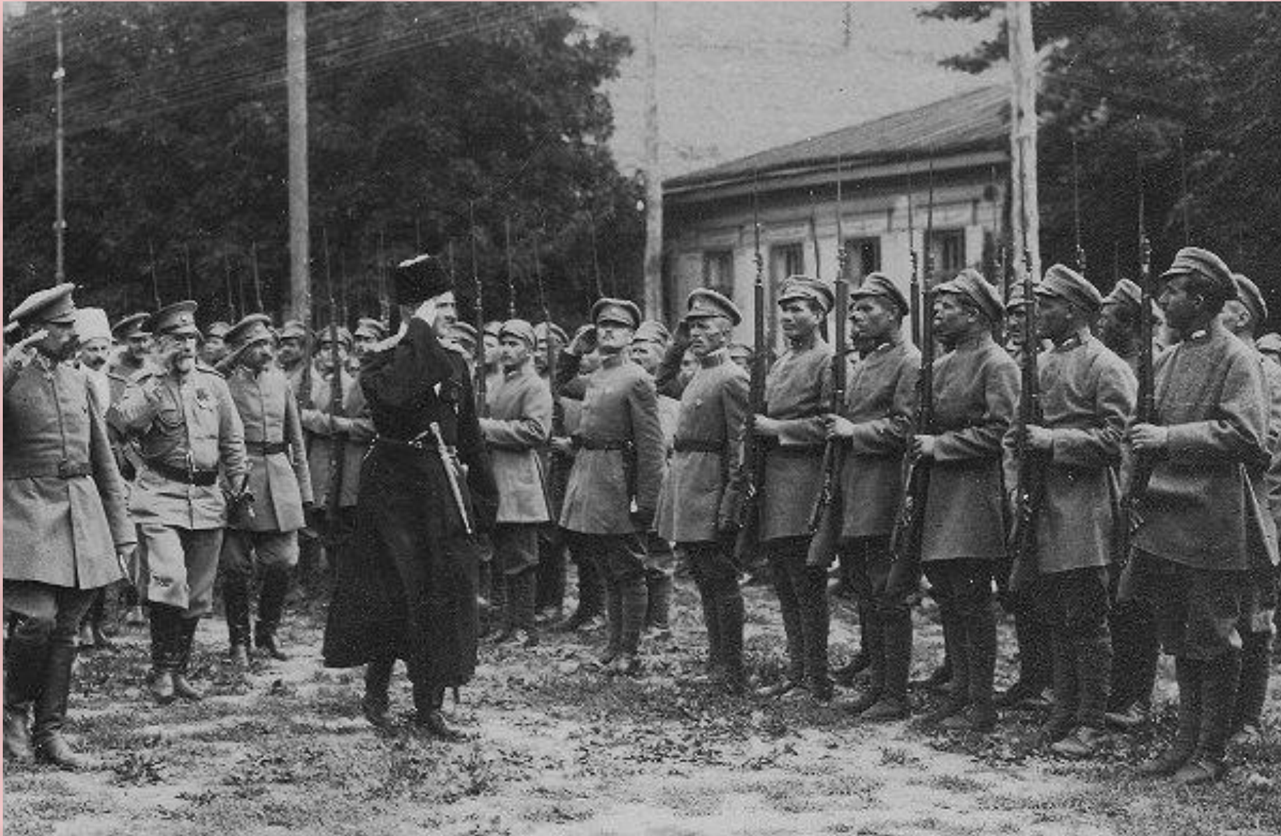
Гетьман Соропадський зі штабом оглядає Сірожупанну дивізію. Серпень 1918 року