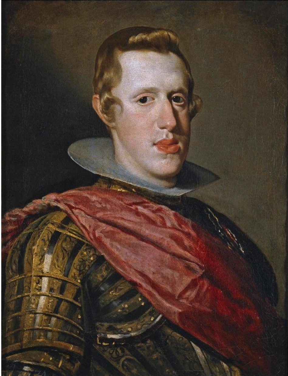
Веласкес - Филипп IV (1605-1665)