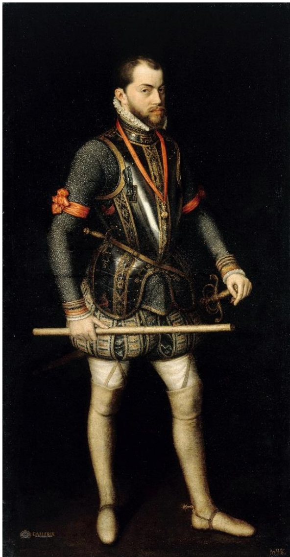
Коэльо - Филипп II (1527-1598) Берлин КГ