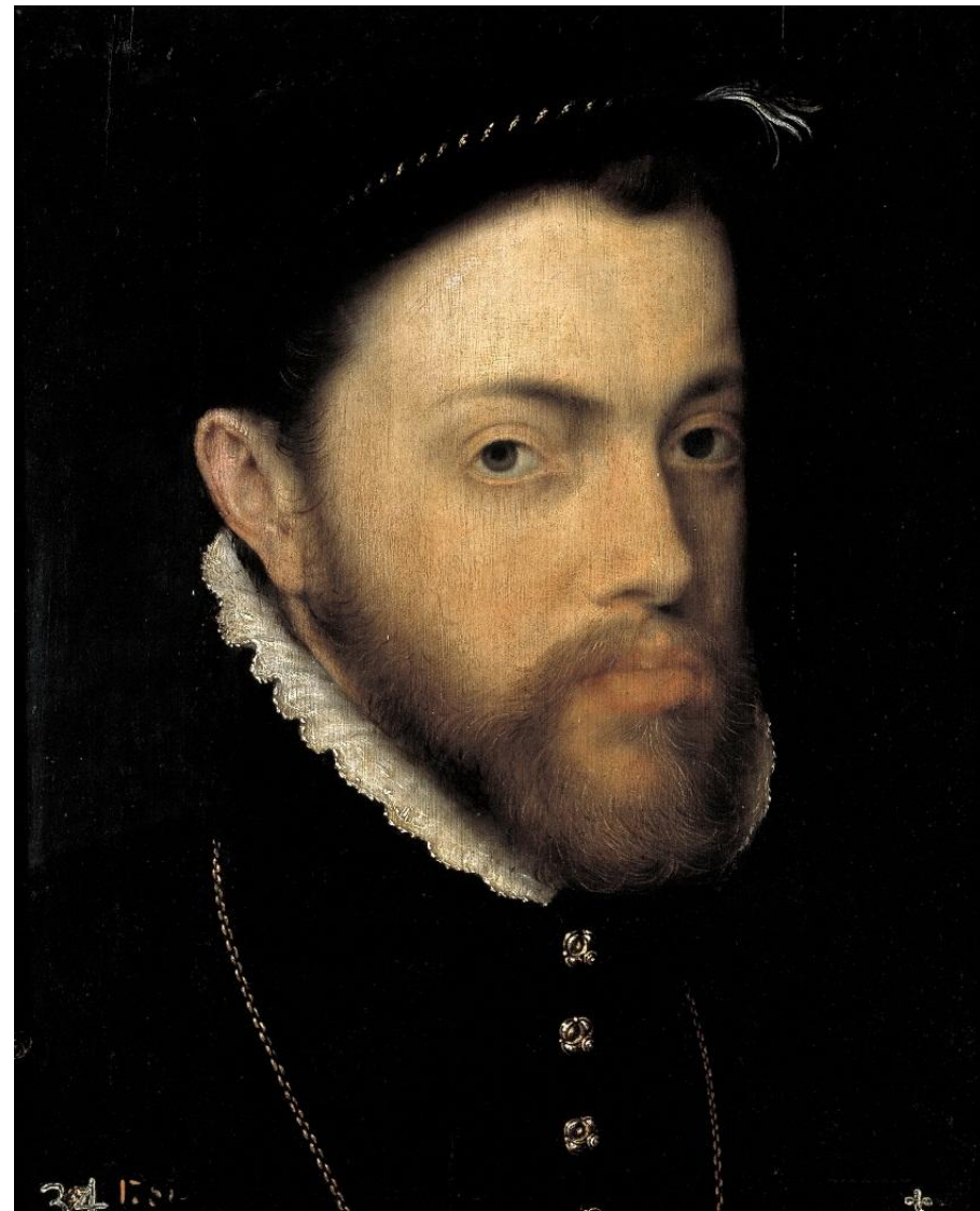
Мор - Филипп II 1555-58 Прадо