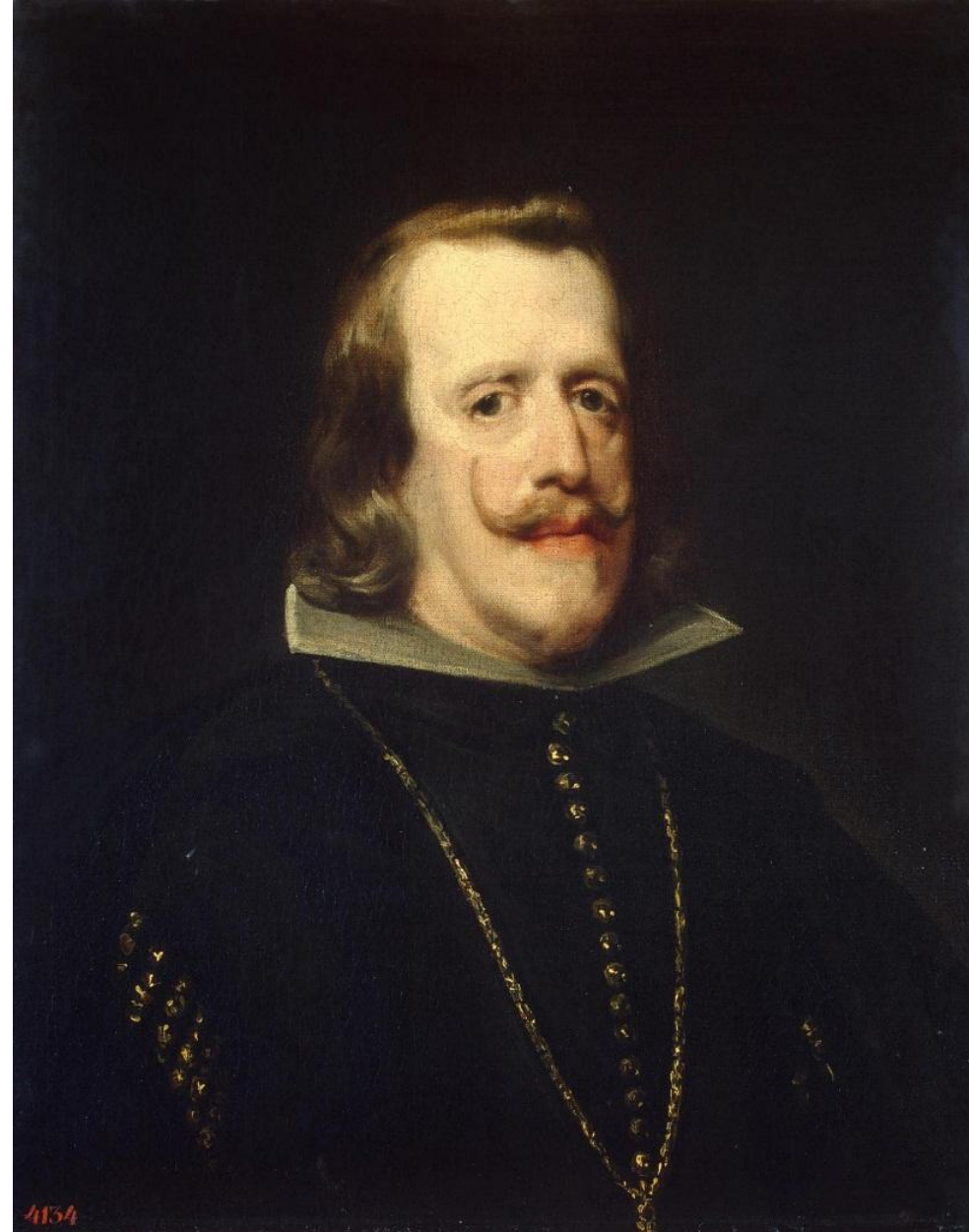
Веласкес, (Мастерская) - Филиппа IV 1656-60 Эрмитаж (Зал 239)