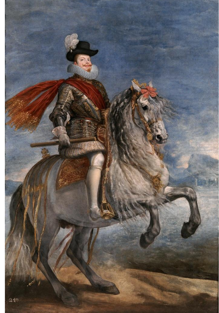
Веласкес Конный портрет Филиппа III 1634-35 Прадо