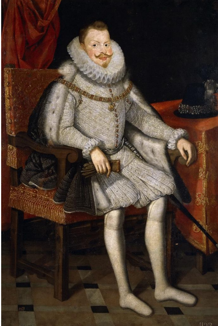
Гонсалес Бартоломе - Филипп III (1578-1623)