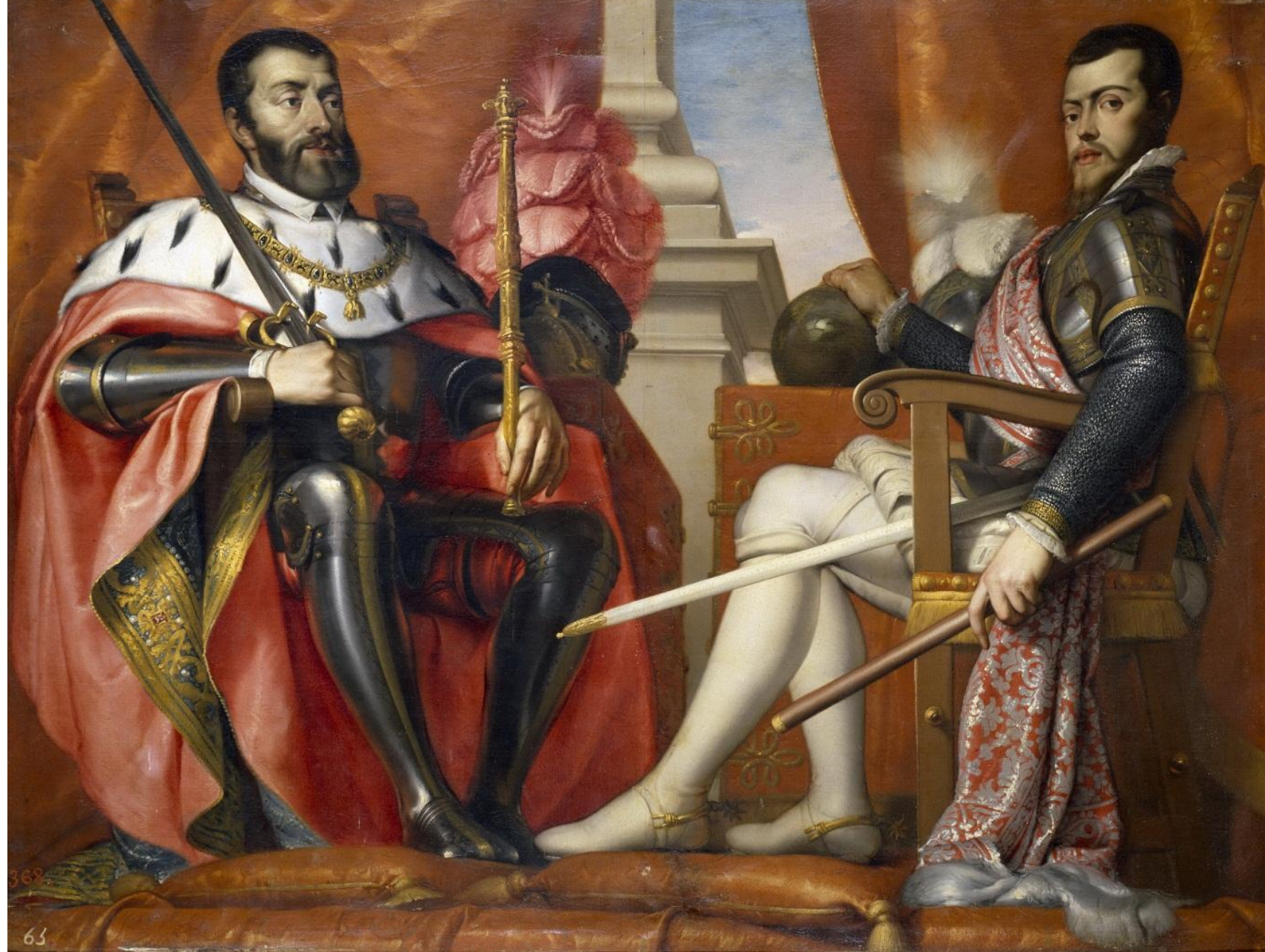
Ариас Фернандес - Карл V и Филипп II 1639-40 Прадо