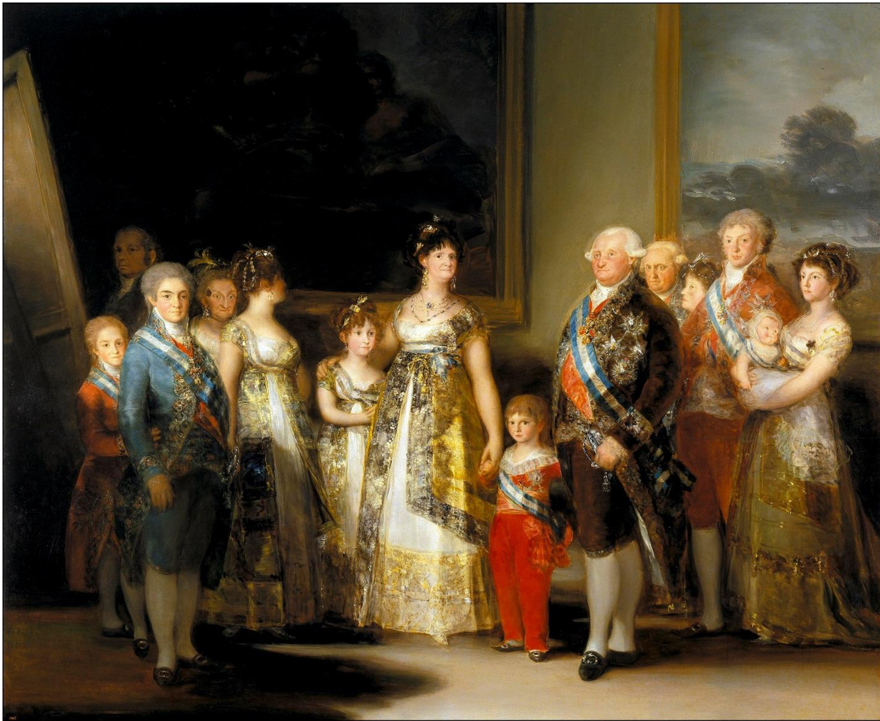
Гойя - Портрет семьи Карла IV 1800 Прадо