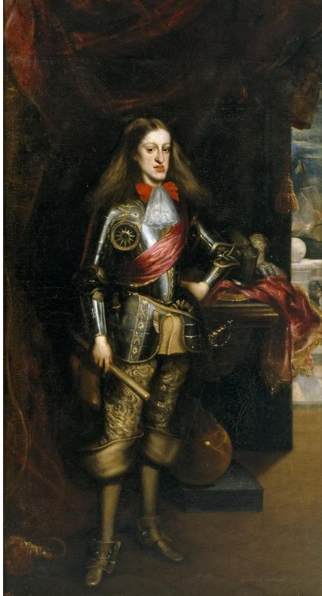
Миранда - Карлос II (1661-1700) 1681 в доспехах Прадо