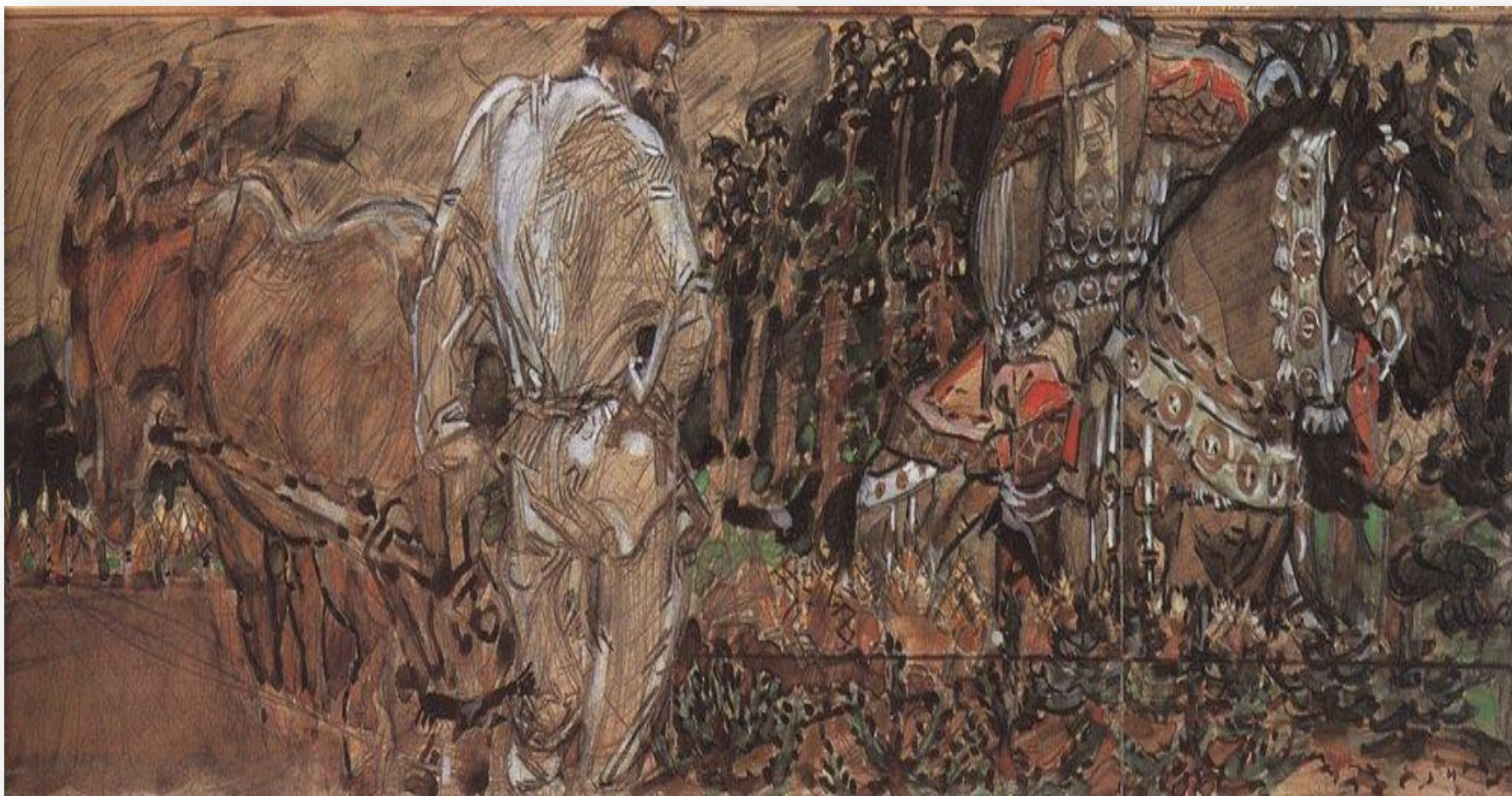
Врубель. «Микула Селянинович». 1896