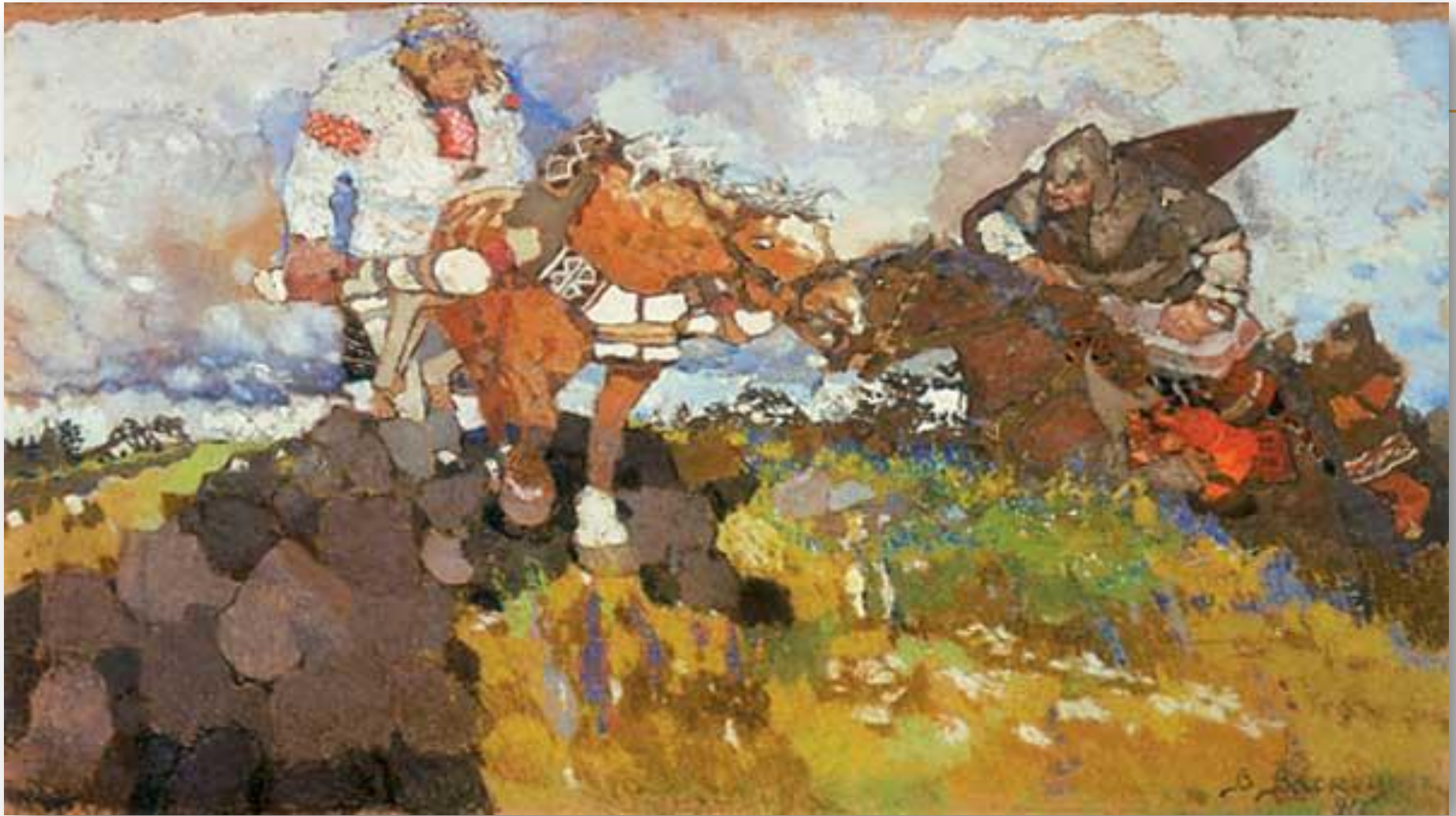
В.М.Васнецов.«Микула Селянинович». 1917 г