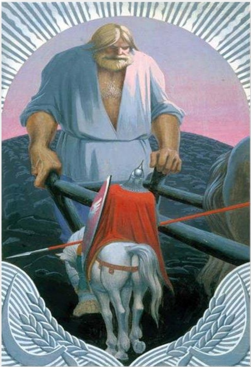
К.Васильев. «Микула Селянинович»