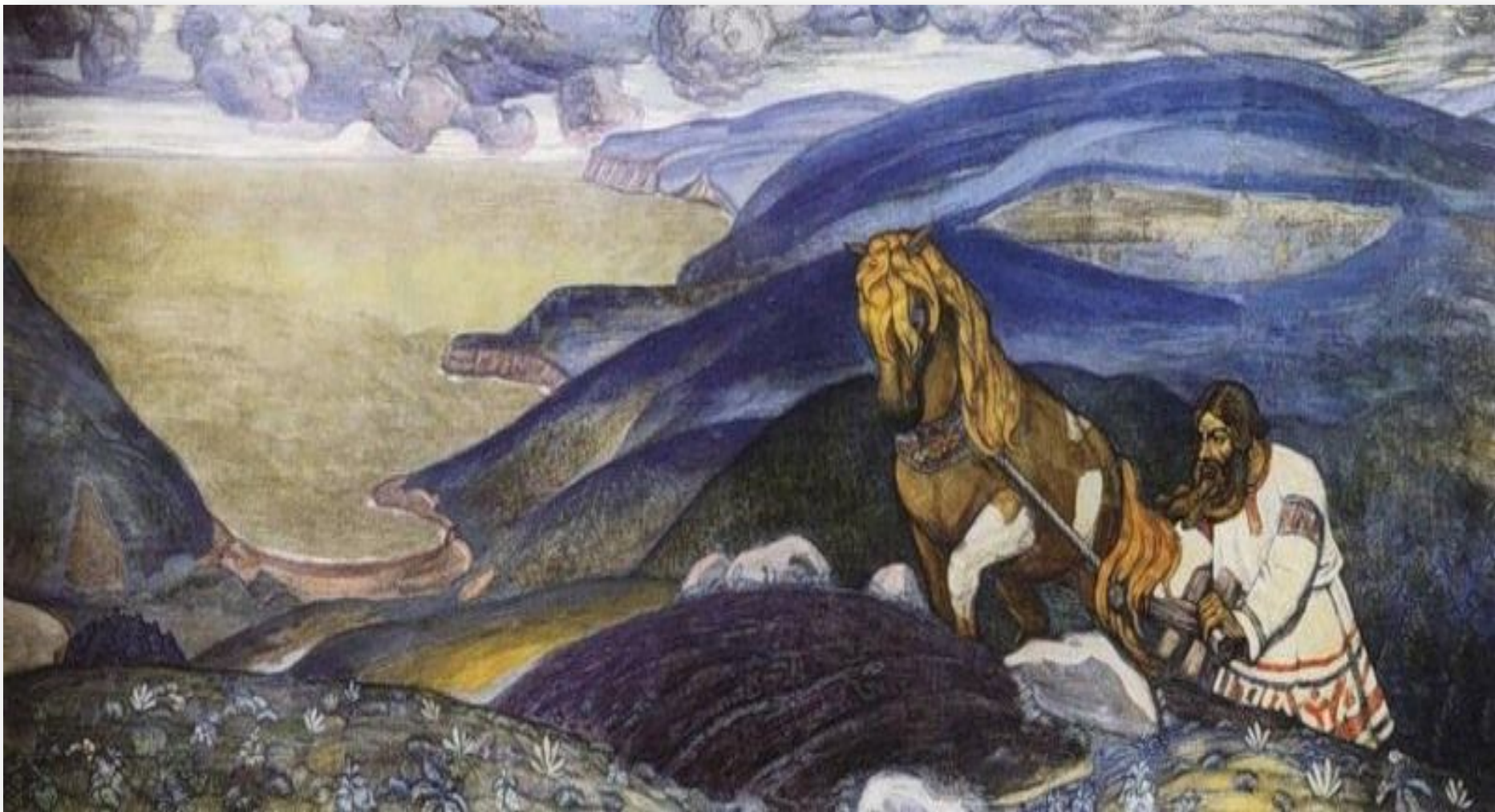
Николай Рерих. "Микула Селянинович"