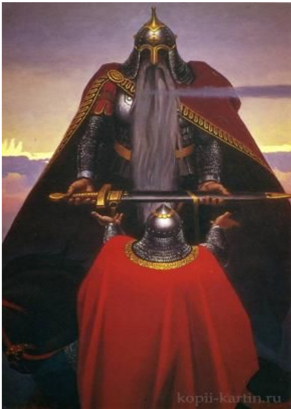
К.Васильев. «Дар Святогора Илье Муромцу»