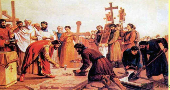
Начало строительства церкви св.Богородицы в Киеве (Десятинной)