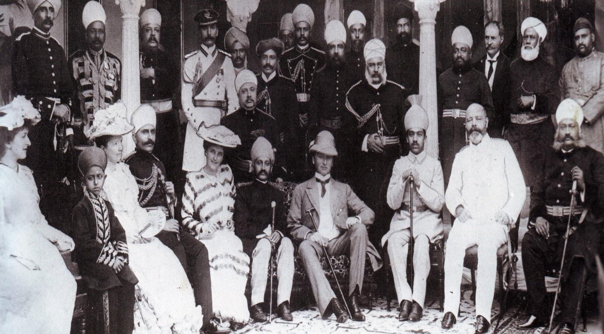
Вице-король Индии Керзон с индийской знатью