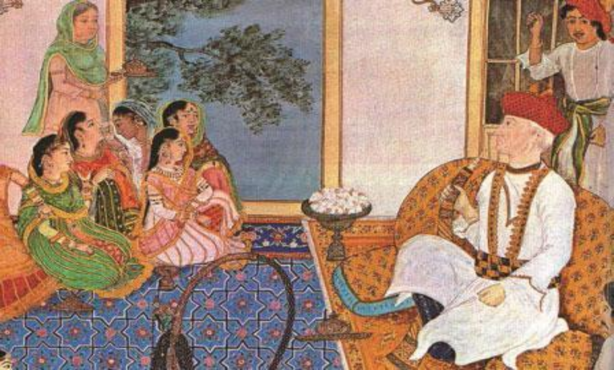
Английский чиновник в Индии