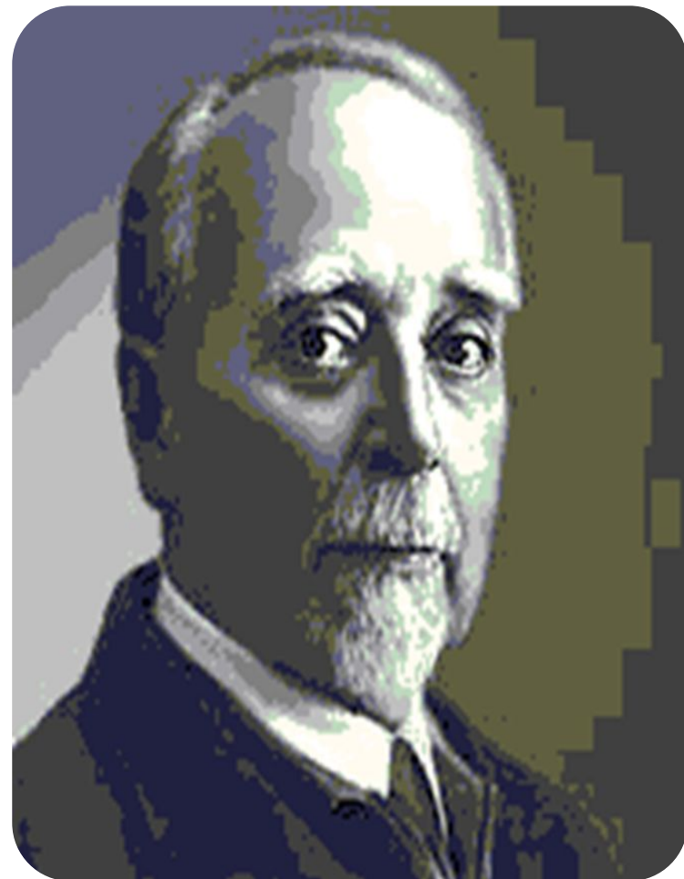
Г. Кржижановский председатель ГОСПлана

ресурсов и потребностей развития промышленности