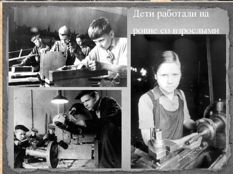
Дети работали на ровне со взрослыми