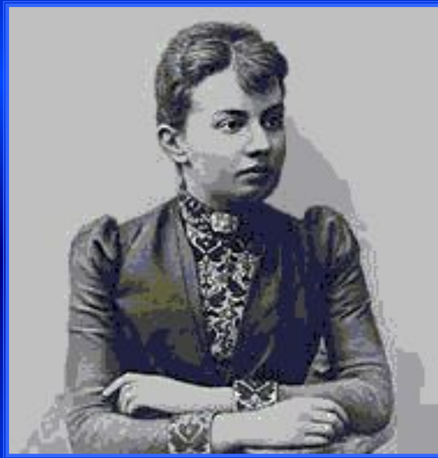
Софья Васильевна Ковалевская