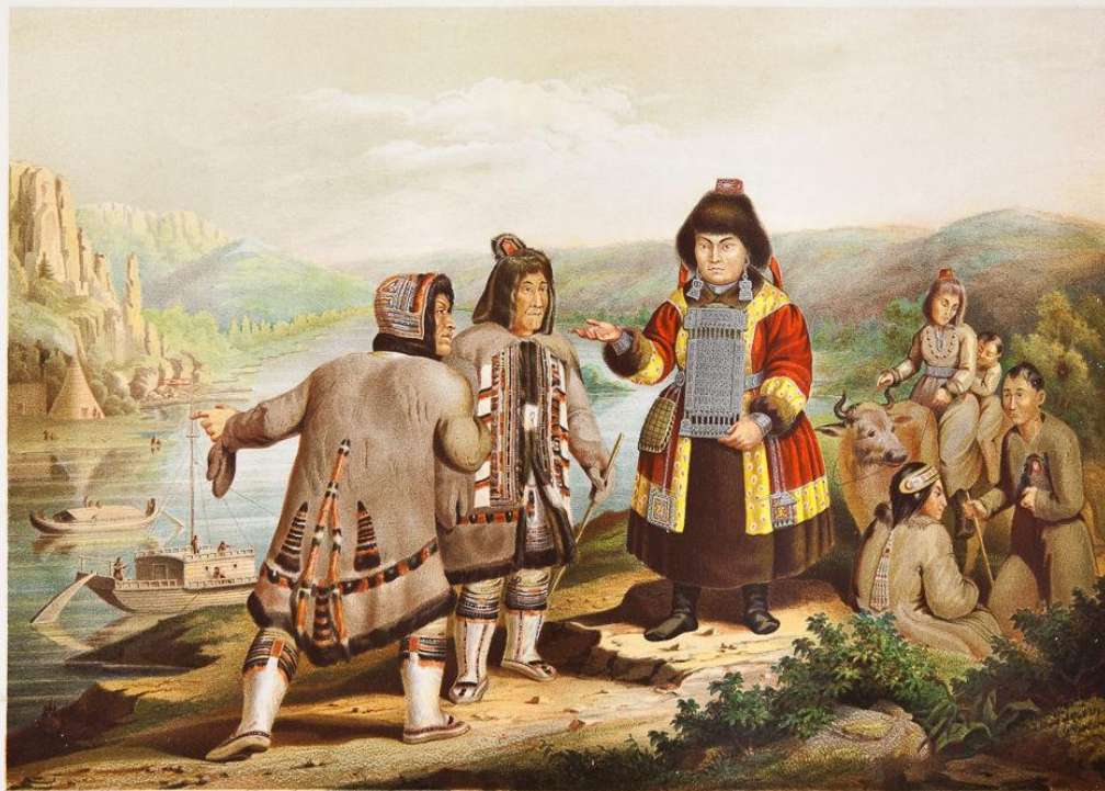
YAKOUTES. (Vue prise sur la Lena.)