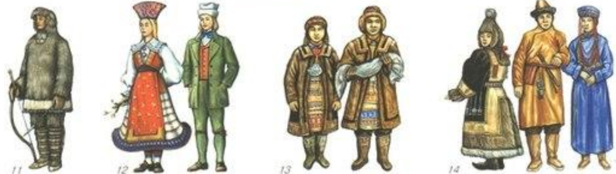
1. Ханты. 2. Черкесы. 3. Черногорцы. 4. Чеченцы. 5. Чуваши. 6. Чукчи. 7. Шорцы. 8. Эвенки. 9. Эвены. 10. Энцы. 11. Эскимосы. 12. Эстонцы. 13. Юкагиры. 14. Якуты