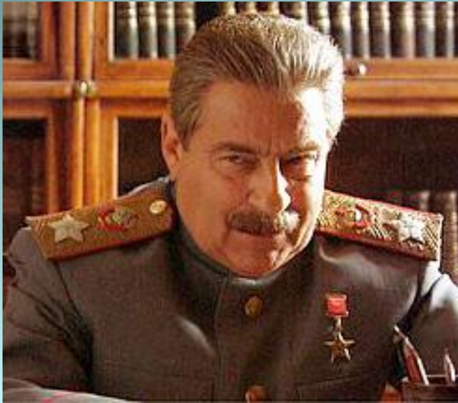
Геннадий Хазанов в роли Сталина

Портретный – используется при изображении конкретного узнаваемого лица.