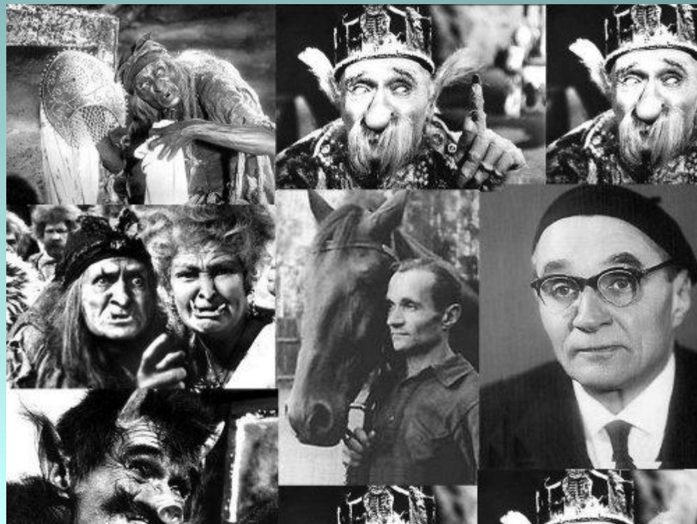
Роли Георгия Милляра

Сказочный, или фантастический используемый при воплощении вымышленных персонажей, либо «очеловеченных» образов: Баба-Яга или Кощей Бессмертный в русских сказках.