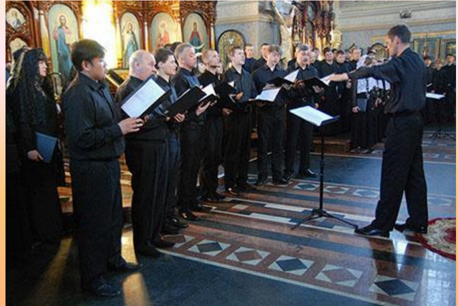
(Астраханский архиерейский хор)

Истоки зарождения и становления профессиональной музыкальной культуры Астрахани лежат в весьма не отдаленном обозримом прошлом и ее история связана с представителями разных национальностей, однако преимущество имели деятели российского музыкального искусства. Вероятно, историю профессиональной музыкальной культуры Астрахани уместнее отсчитывать с начала XVII в., когда «был создан по образцу Московского патриаршего хора профессиональный церковно-певческий коллектив - Астраханский архиерейский хор», существующий и поныне.