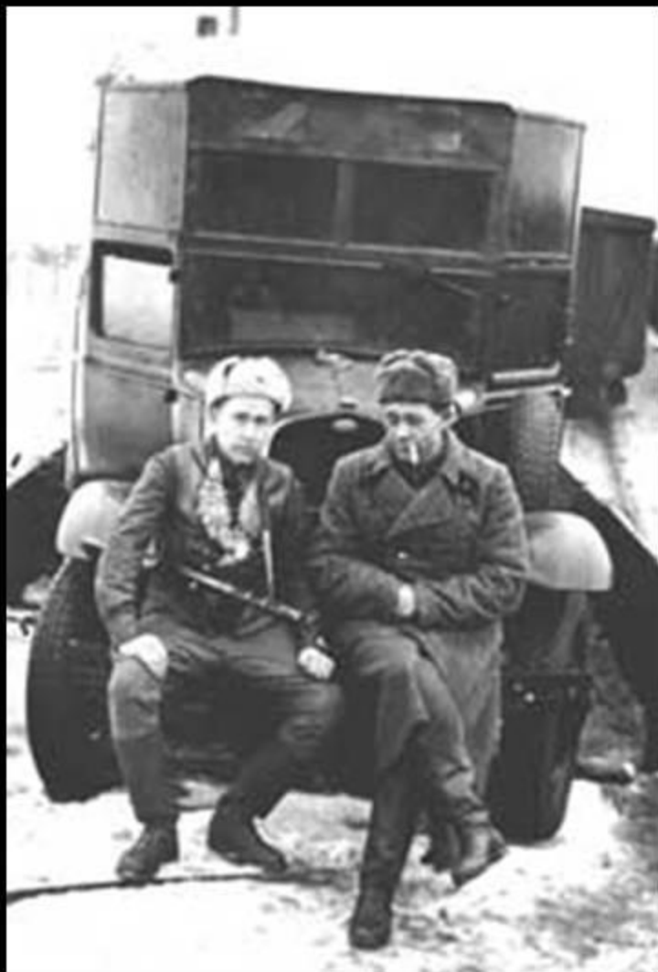
Лейтенант Солженицын (слева) с командиром артдивизиона

Солж — «выс лагерям коснулас слабост рукам, б выпало лагерны Дэр, «на КВЧ — считали