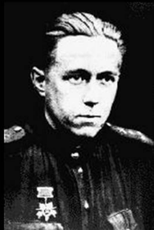
Ст. лейтенант Солженицын. Брянский фронт. 1943 г.

лузском сперва острый годился Образ авшего гда не опыта а — все