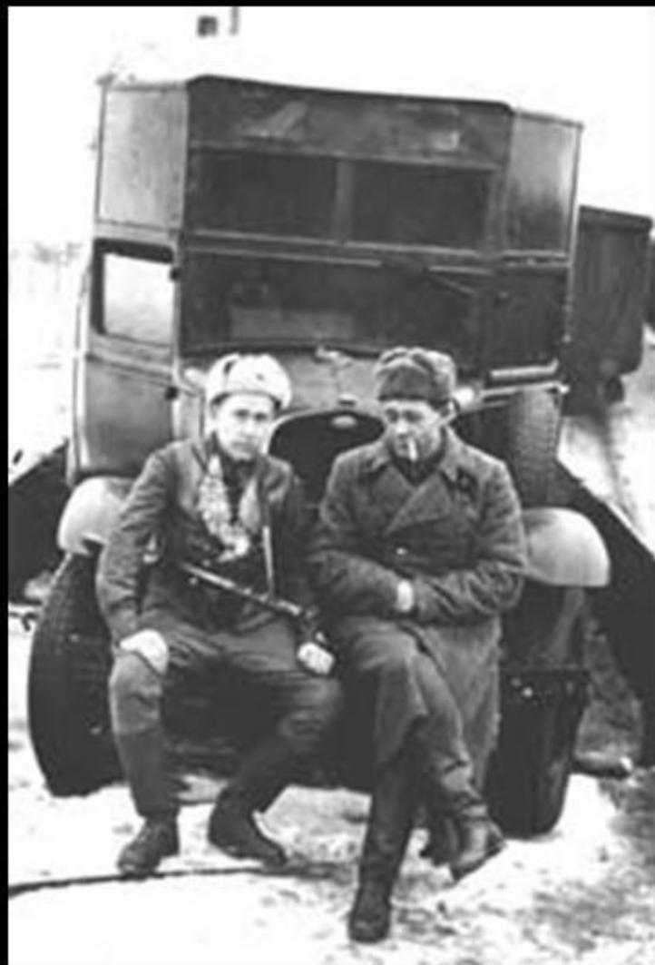
Лейтенант Солженицын (слева) с командиром артдивизиона

Задум Особом как «Д полити для пос Ивана Д с авто сидевш автора из лагер