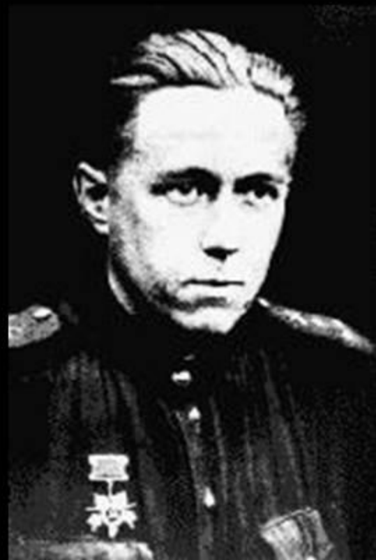
Ст. лейтенант Солженицын. Брянский фронт. 1943 г.

о имени ьмам и его не но не до о. И по е много рки» — есятник один из аботяги