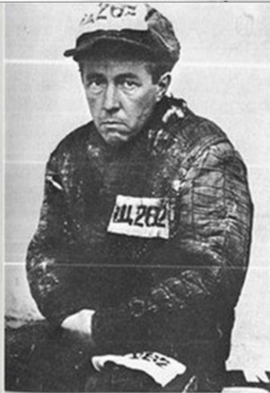
1. Особлар (сразу по выходе), 1953 г.