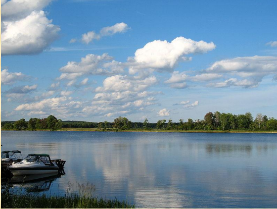
Природа озера Селигера

озера и его живописнейших окрестностей представляют многочисленные экскурсии