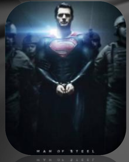
"Людина зі сталі"(2013)