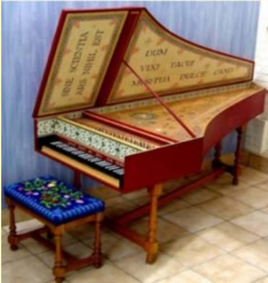
Клавесин XVII век