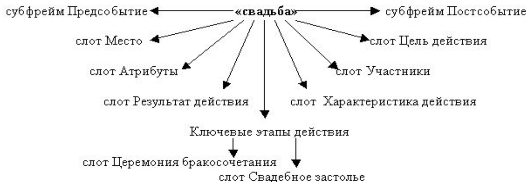
Рис.2. Фрейм «свадьба» в русской лингвокультуре.