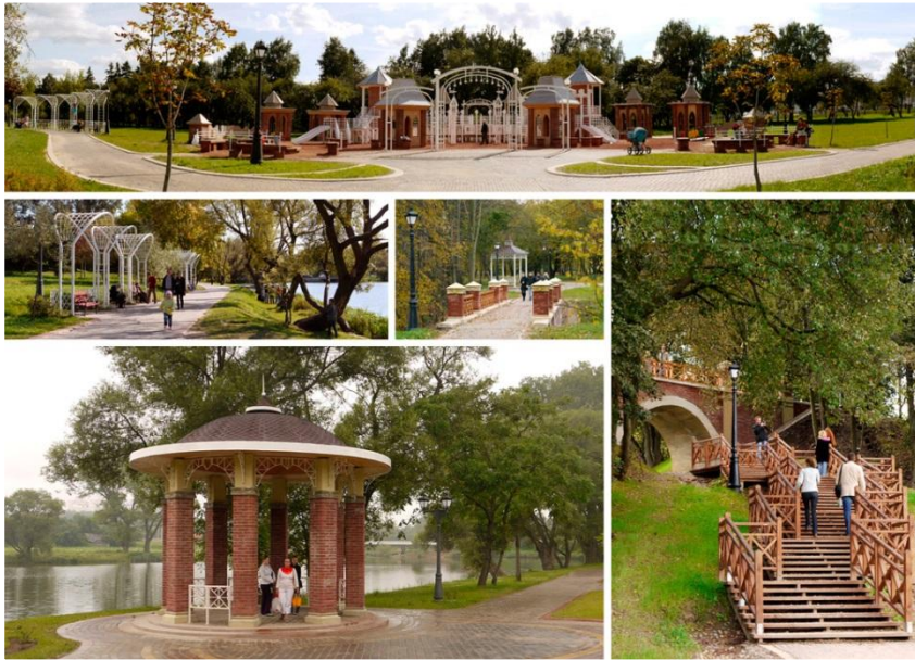
Реконструкция Лошицкого усадебно-паркового комплекса в г. Минске

Ландшафт для современной цивилизации не роскошь, а жизненная необходимость. Недостаточно, если пейзаж просто радует глаз и доставляет удовольствие. Задача гораздо сложнее – необходимо выразить скрытый в глубинах подсознания «второй» неведомый мир.