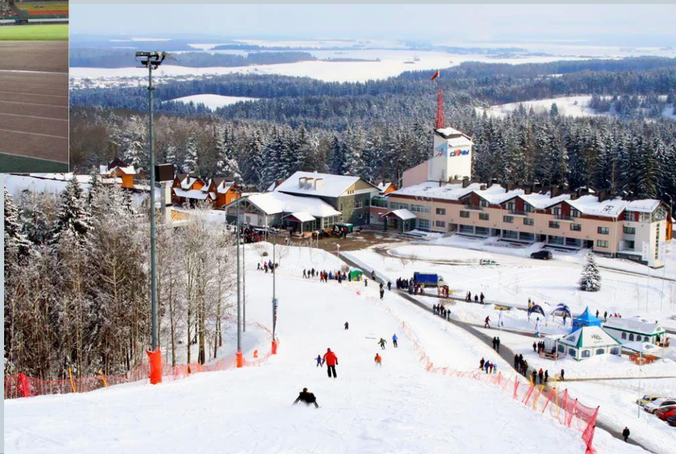
Республиканский горнолыжный курорт «Силичи»