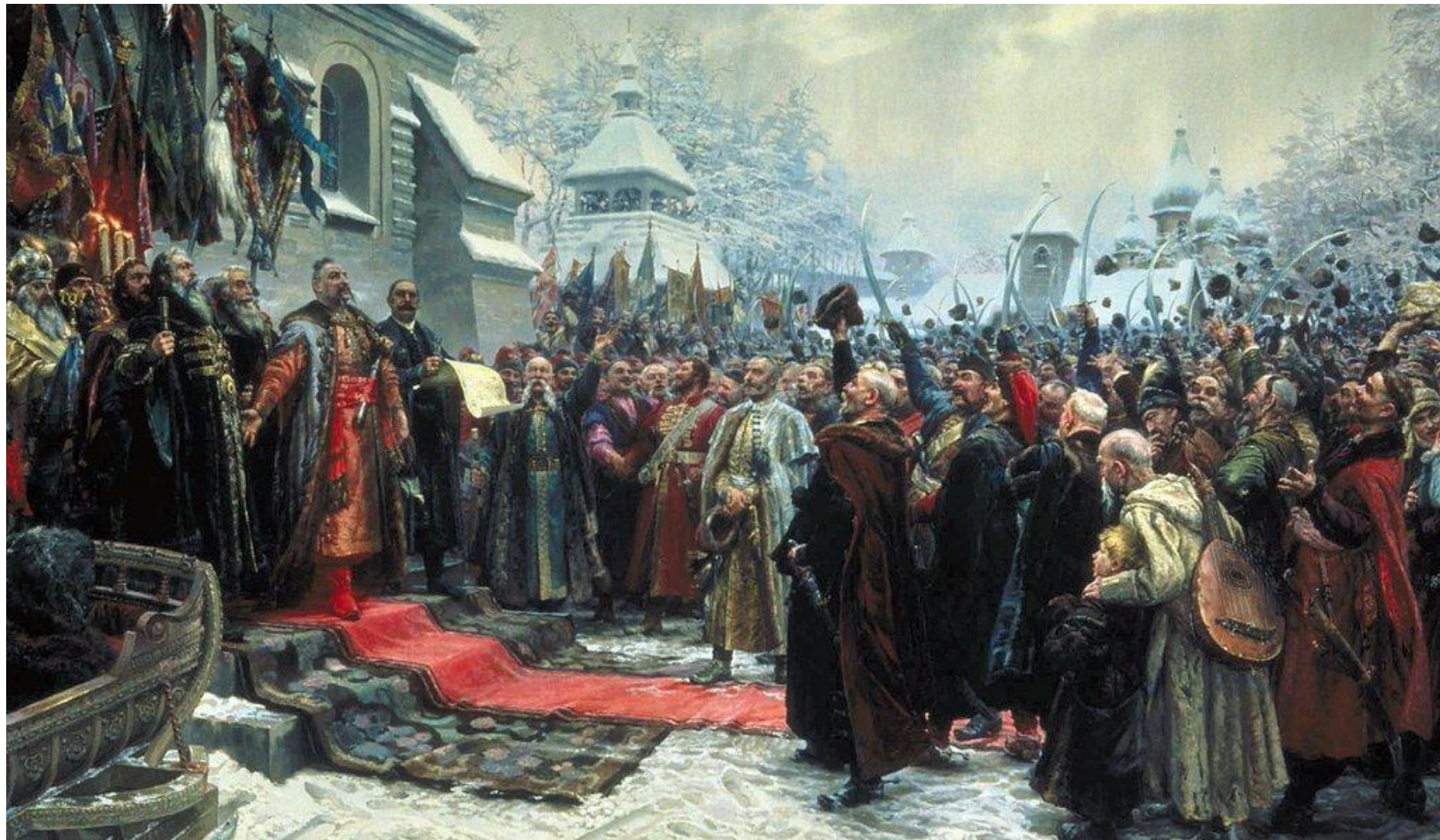
Переяславская Рада. Художник М. И. Хмелько