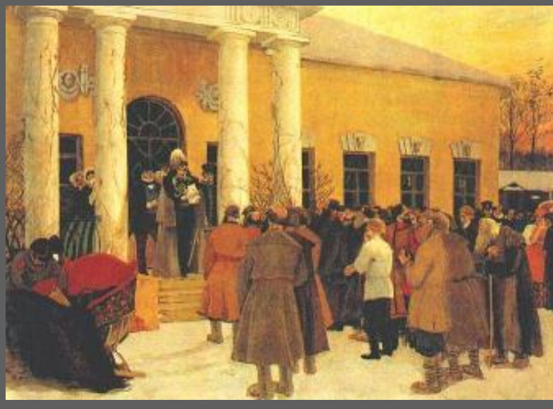
Б.Кустодиев Освобождение крестьян

Размер выкупа должен был сохранить доход помещика от оброка. Он равнялся сумме, которая будучи положенной в банк при 6% годовых, давала доход равный оброку. Крестьянин платил 20%, остальное вносило государство, давая крестьянам ссуду на 49 лет, при этом расчет велся не с крестьянином, а с общиной.