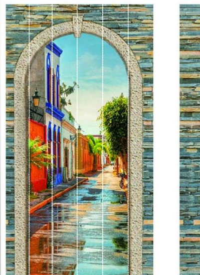
Таормина Арт. А