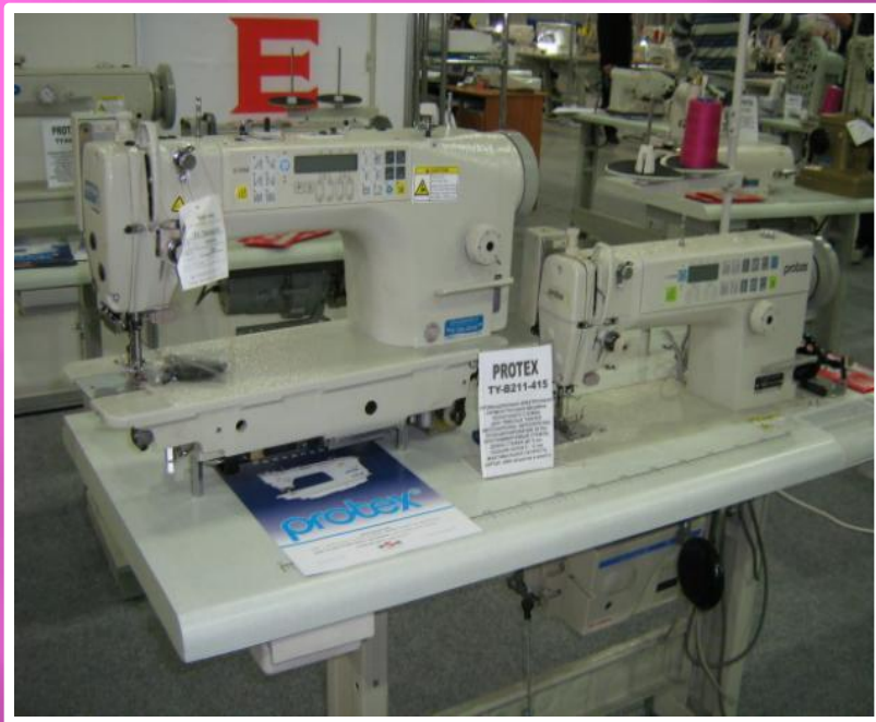
Швейная промышленная машина