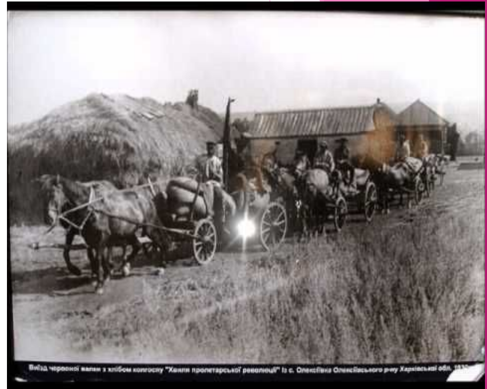
Вид червоної вагони з хлібом колгоспу "Хліби пролетарської революції" із с. Олександрівка Олександрівського району Харківської обл., 1935