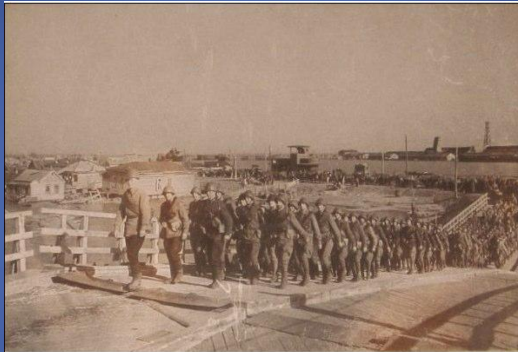
ЮЖНЫЙ ФРОНТ. НОЯБРЬ 1942 Г.

29 ноября после ожесточённых уличных боёв фашистские войска были выбиты из Ростова.