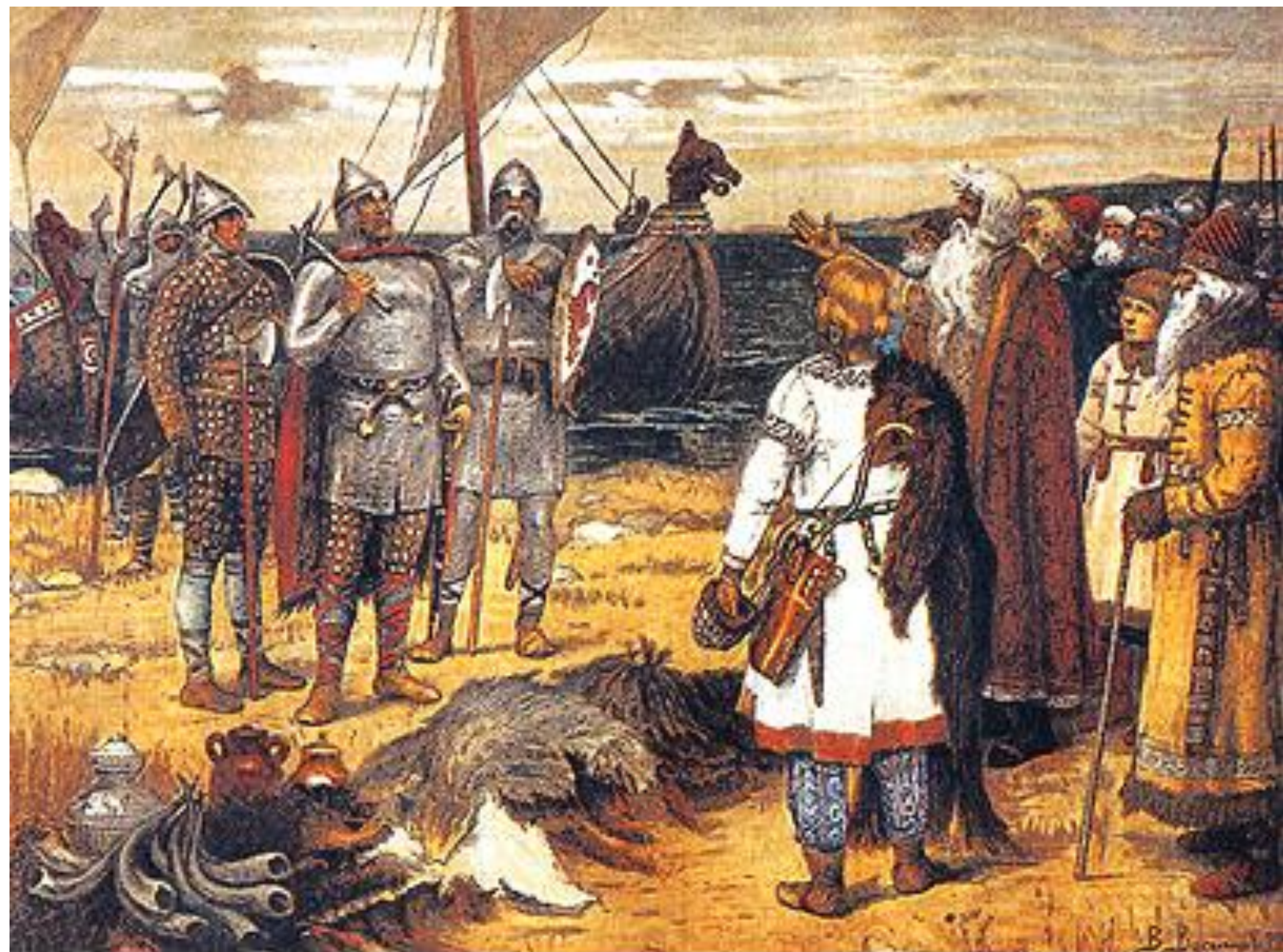
А.М. Васнецов. "Варяги"