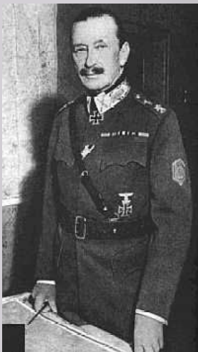
Карл Густав Эмиль Маннергейм

29 ноября 1939 г. – денонсация (?) договора о