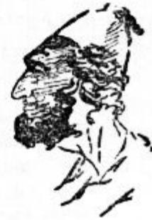
Рисунок А.С. Пушкина