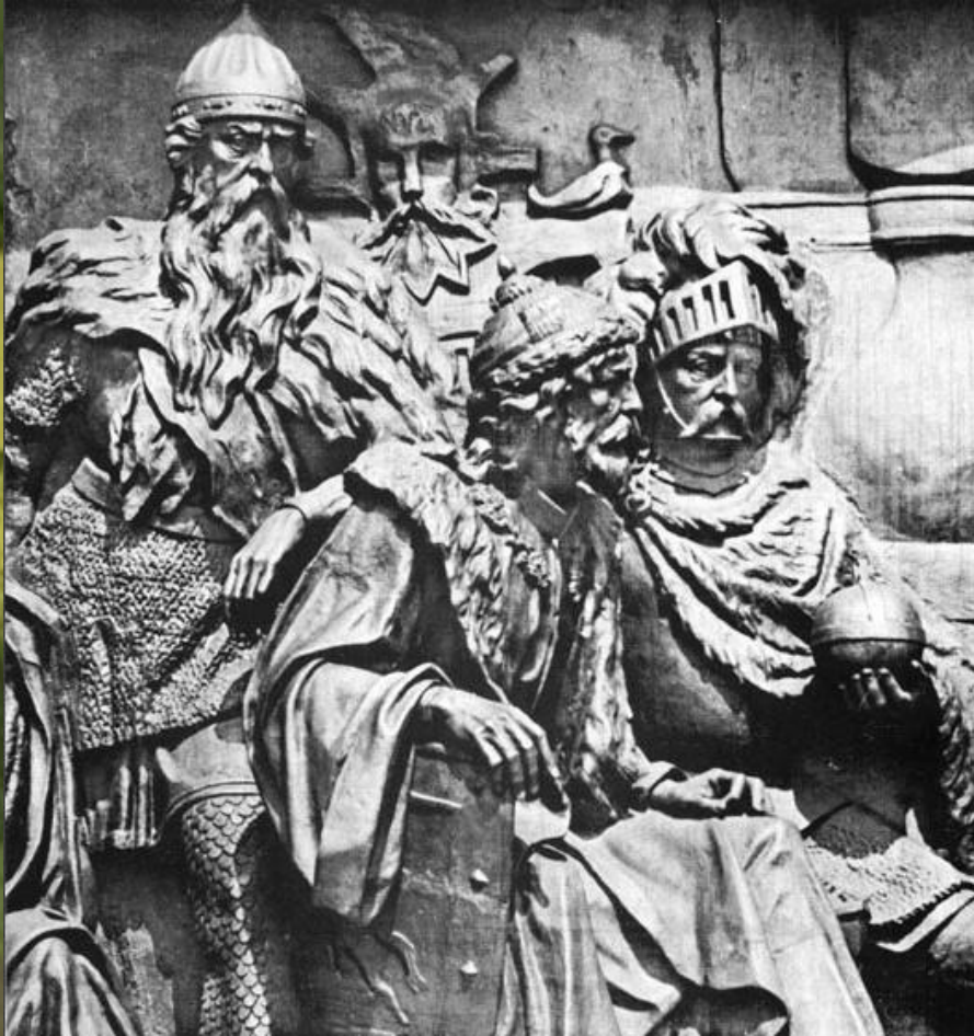
Гедимин, Ольгер, Витовт

Своего расцвета Литовское государство достигло при князе Гидемине. На полоцкий престол литовский князь посадил своего брата.