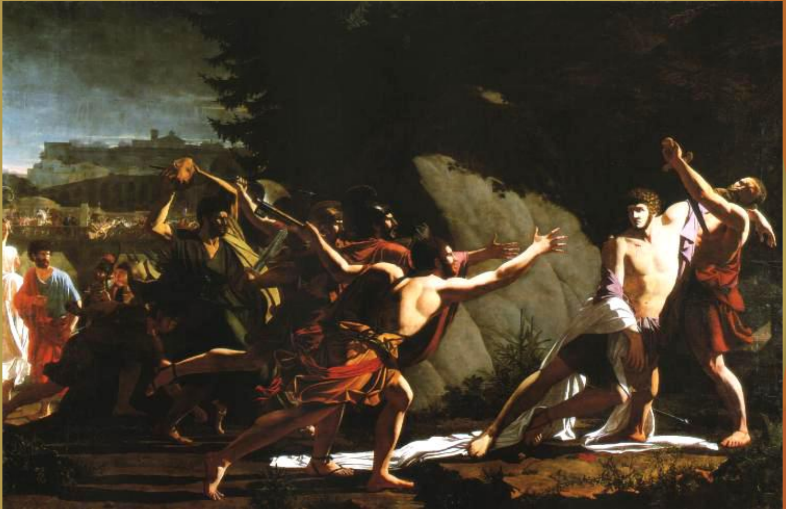
Смерть Гая Гракха, живопись Жана-Батиста Торіно-Лебрена, 1792