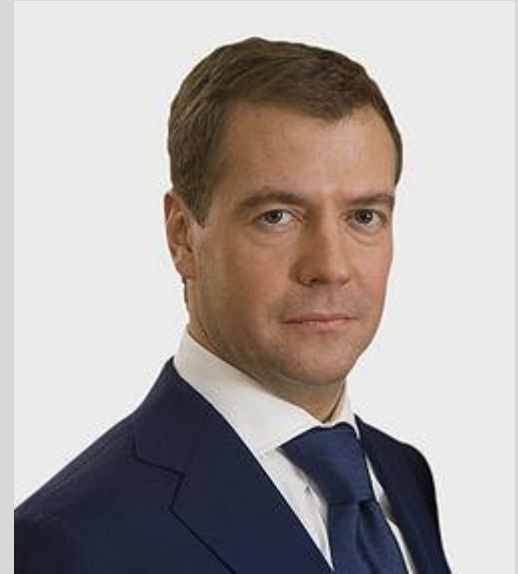
Д. А. Медведев