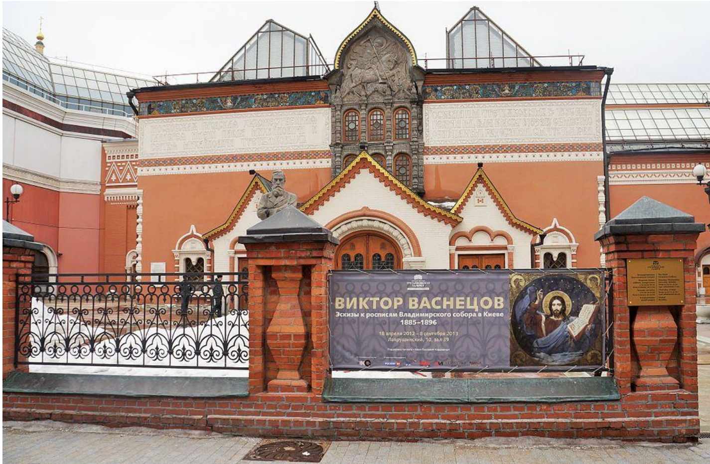
La galerie (d'État) Trétiakov