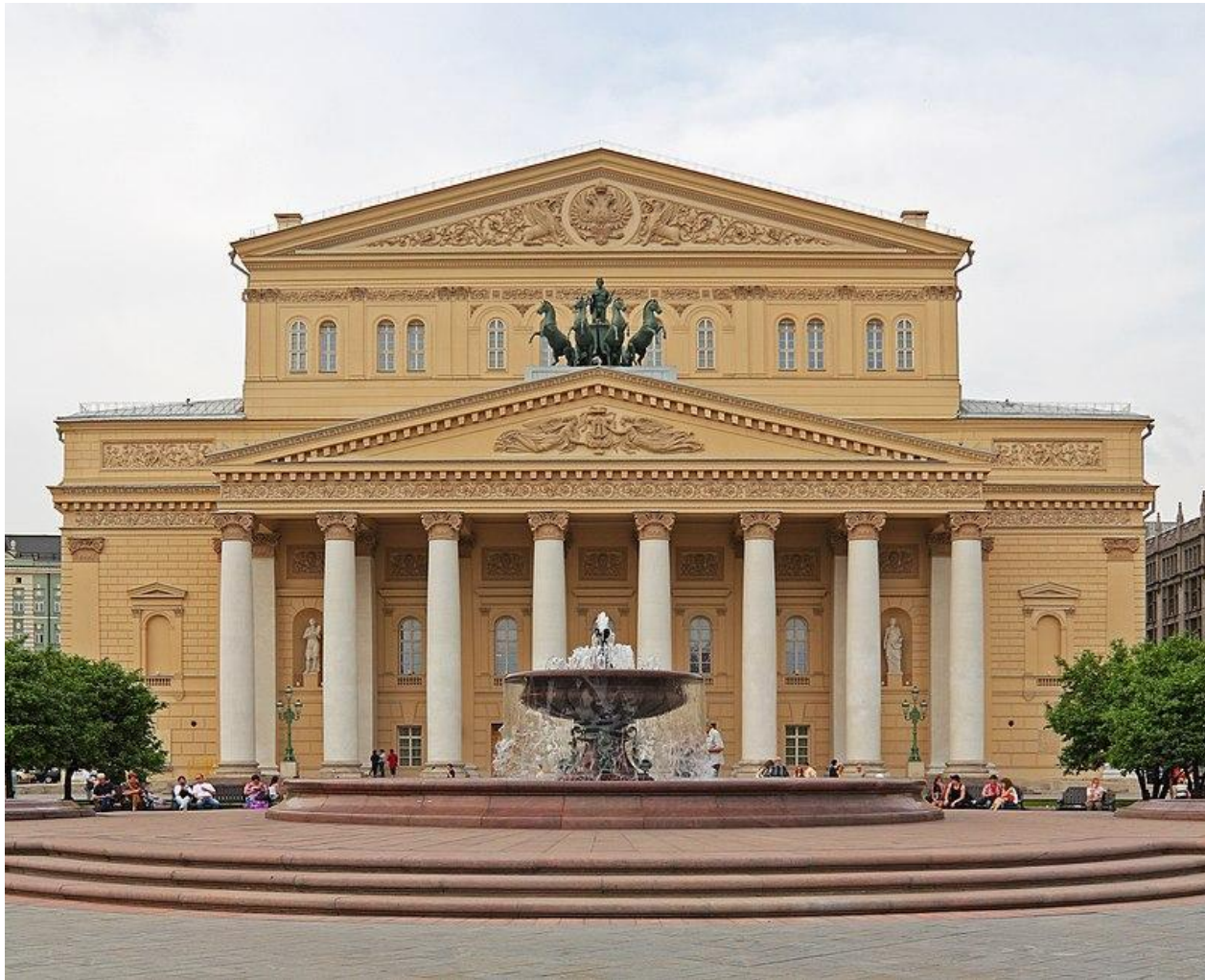
Théâtre Bolchoï (Le Bolchoï)