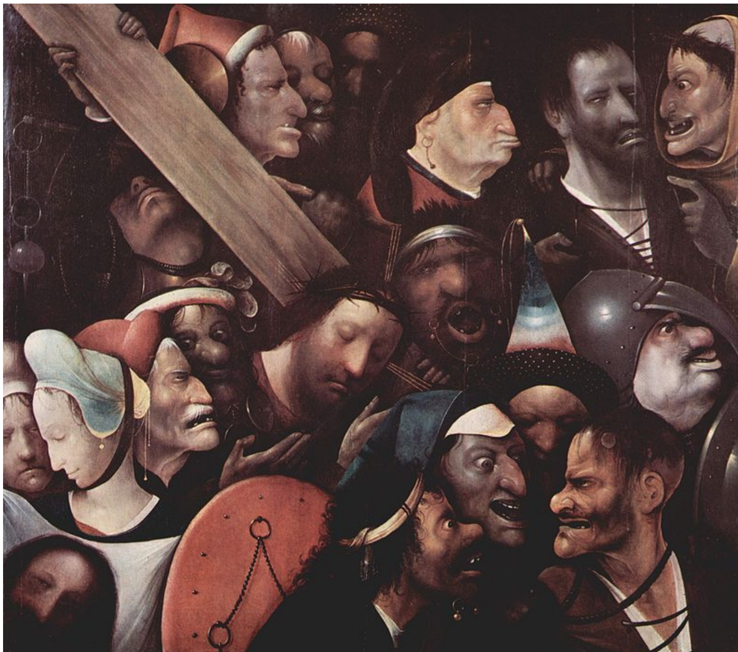
Иероним Босх, Несение креста 1490—1500 гг.