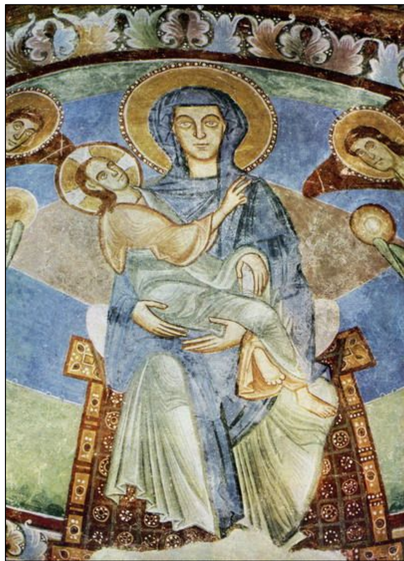
Мадонна и младенец с ангелами и святыми (фрагмент). Южно- тирольский стиль. Поздний 12 век.