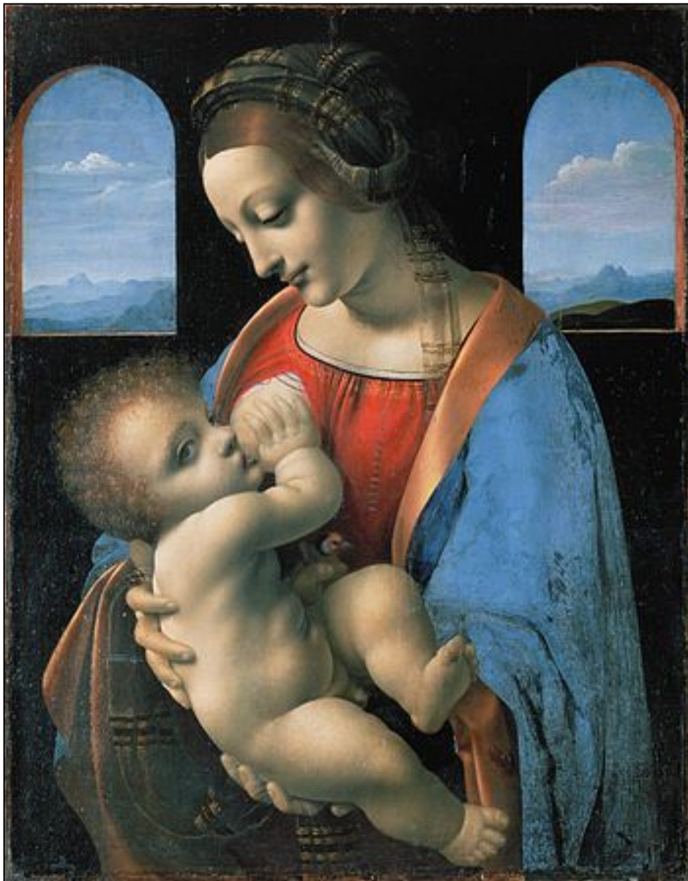
Леонардо да Винчи Мадонна Литта 1490—1491 гг.