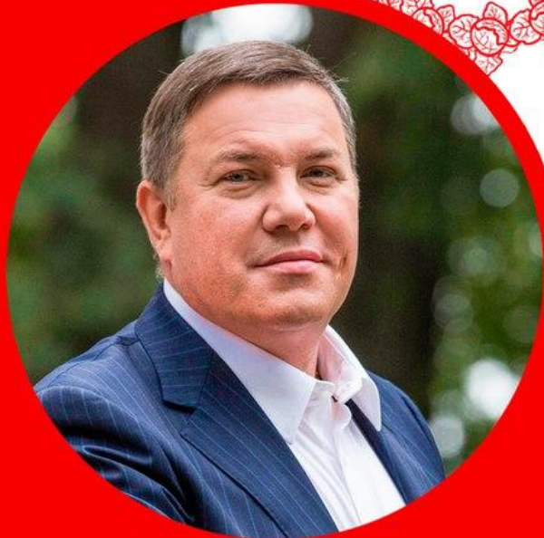
Олег Кувшинников Губернатор Вологодской области