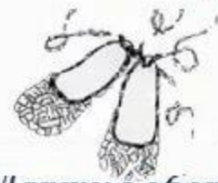
Лапти с оборками