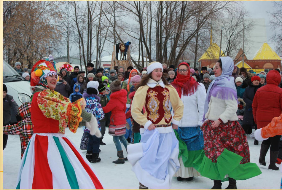
МАСЛЕННИЦА В КУЕДЕ