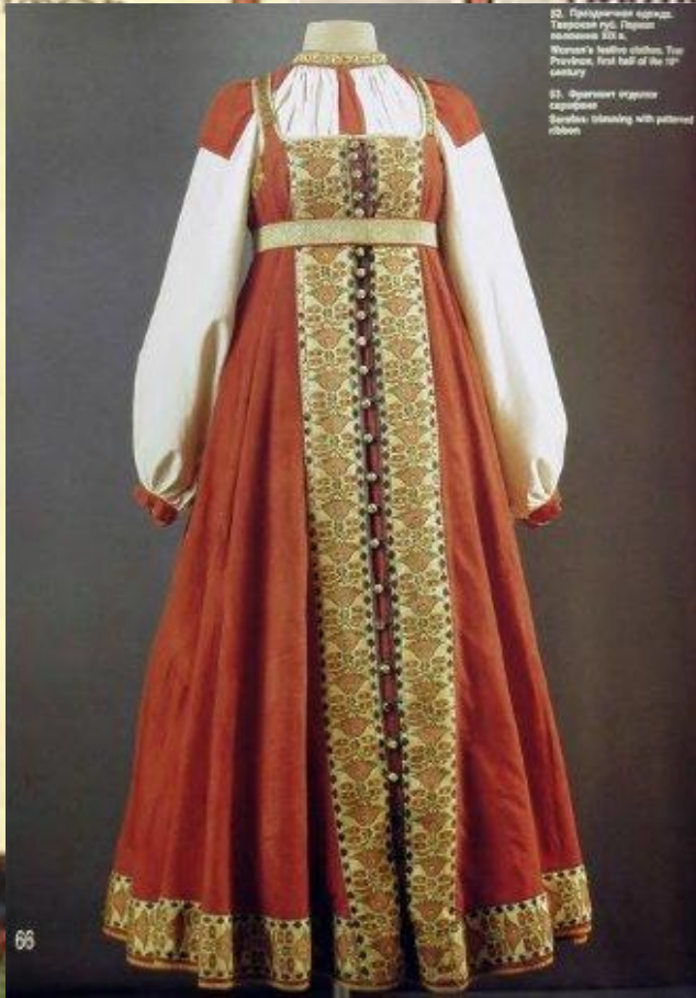
20. Праздничная одежда. Ткацкий рус. Переплет 1822 г. Woman's festive clothes. The Pevenche, first half of the 19 th century 21. Фуршетная старинная одежда. Sundress, elaborating with patterned ribbon