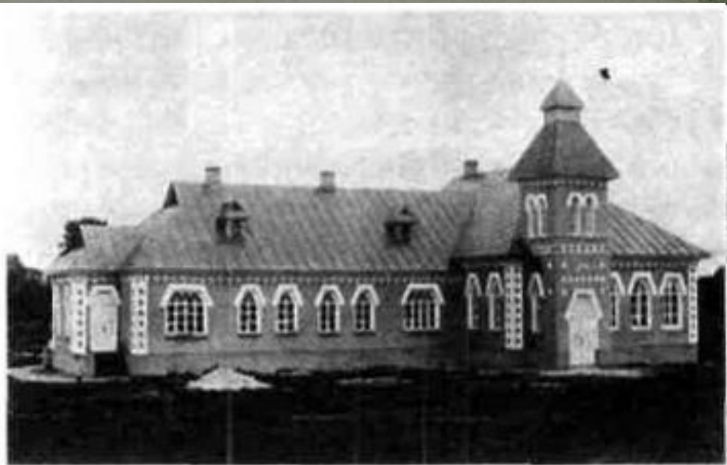
Сільська земська школа Лохвицького повіту Полтавської губернії