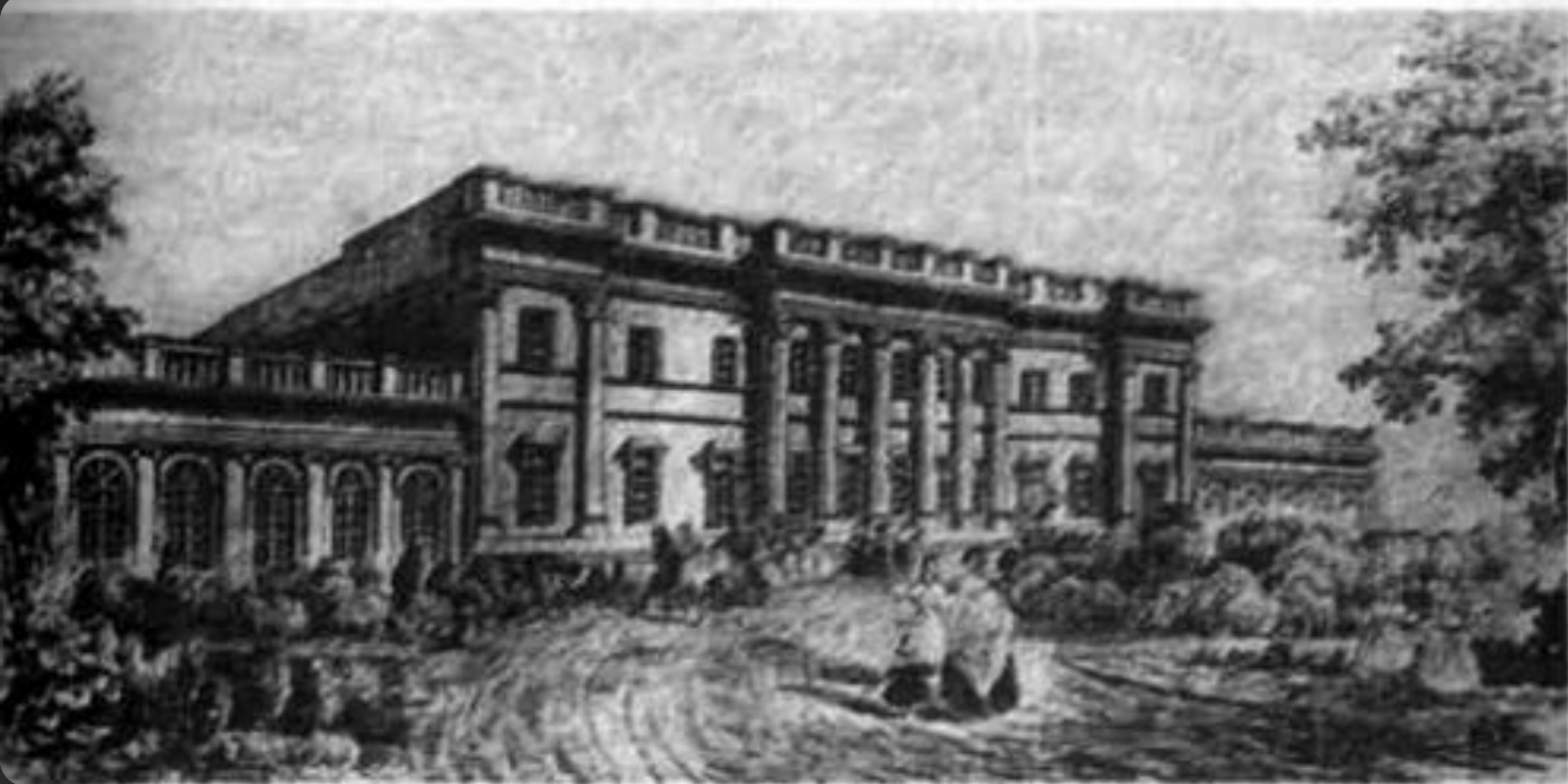
Інститут шляхетних дівчат в Одесі. Із гравюри XIX ст.