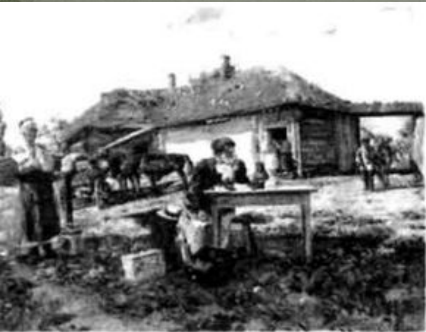
В. Маковський. Приїзд учительки