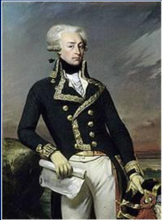
Жильбер де Лафайет

Революция распространялась по всей стране. В городах образовались выборные органы власти - муниципалитеты , создавалась вооруженная сила - Национальная гвардия .