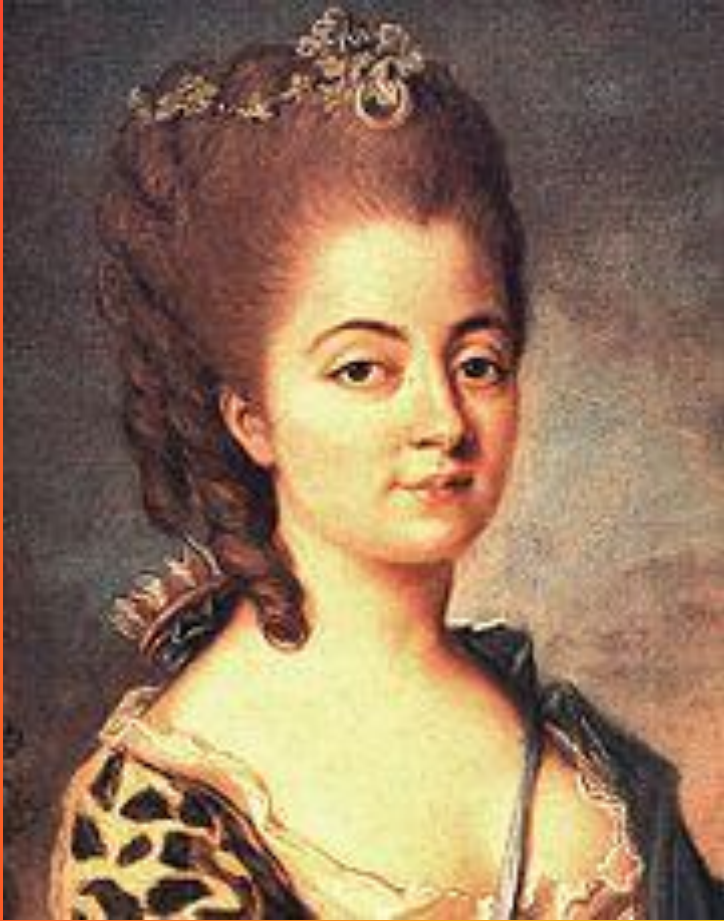
Мария-Аврора Саксонская, бабушка Жорж Санд

Когда бабушка умерла, оставшаяся в одиночестве юная Аврора увлеклась Казимиром Дюдеваном. Они обвенчались в парижском храме в сентябре 1822 г., после чего переехали в поместье Ноан. Однако семейная жизнь столь разных по духу и интересам людей не задалась, хотя в нем родилось двое детей – сын Морис и дочь Соланж, чье отцовство биографы дружно приписывают другому мужчине - Ажассону де Грансаню. Брак быстро превратился в формальность.