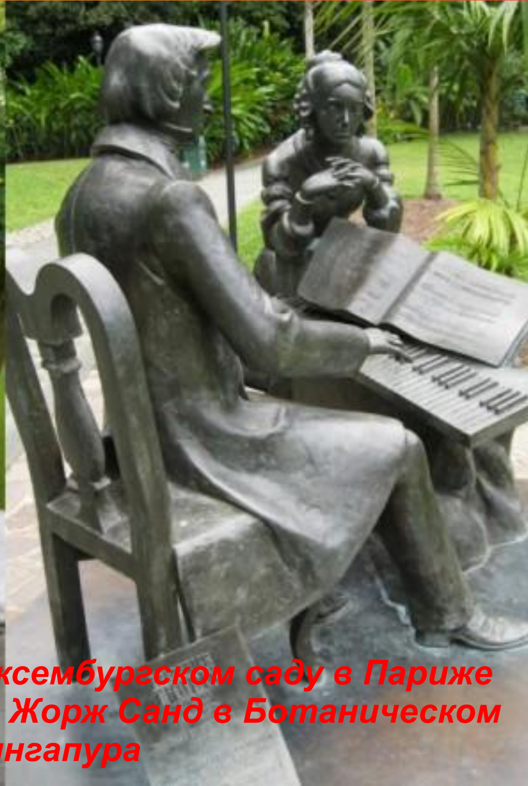
Памятник Жорж Санд в Люксембургском саду в Париже (слева), памятник Шопену и Жорж Санд в Ботаническом саду Сингапура