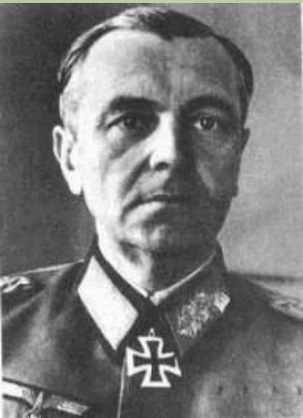
Генерал фельдмаршал Фридрих фон Паулюс

28 января он был награжден только что учрежденным орденом Суворова.