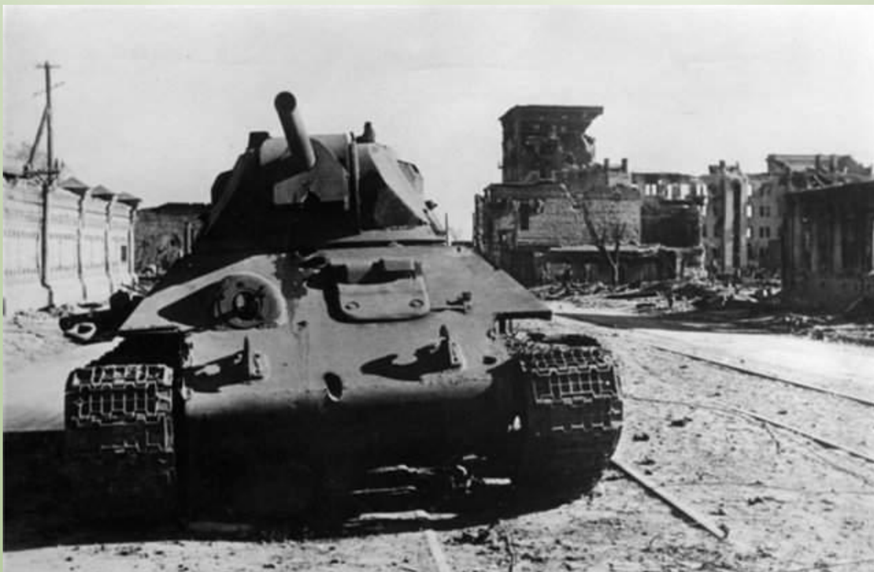
Подбитый советский танк Т-34