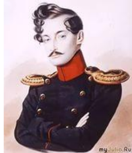
Жорж Шарль Дантес