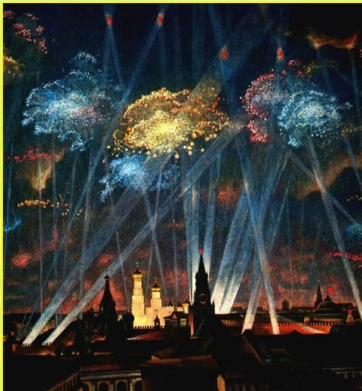
П. Оссовский. "Салют Победы".