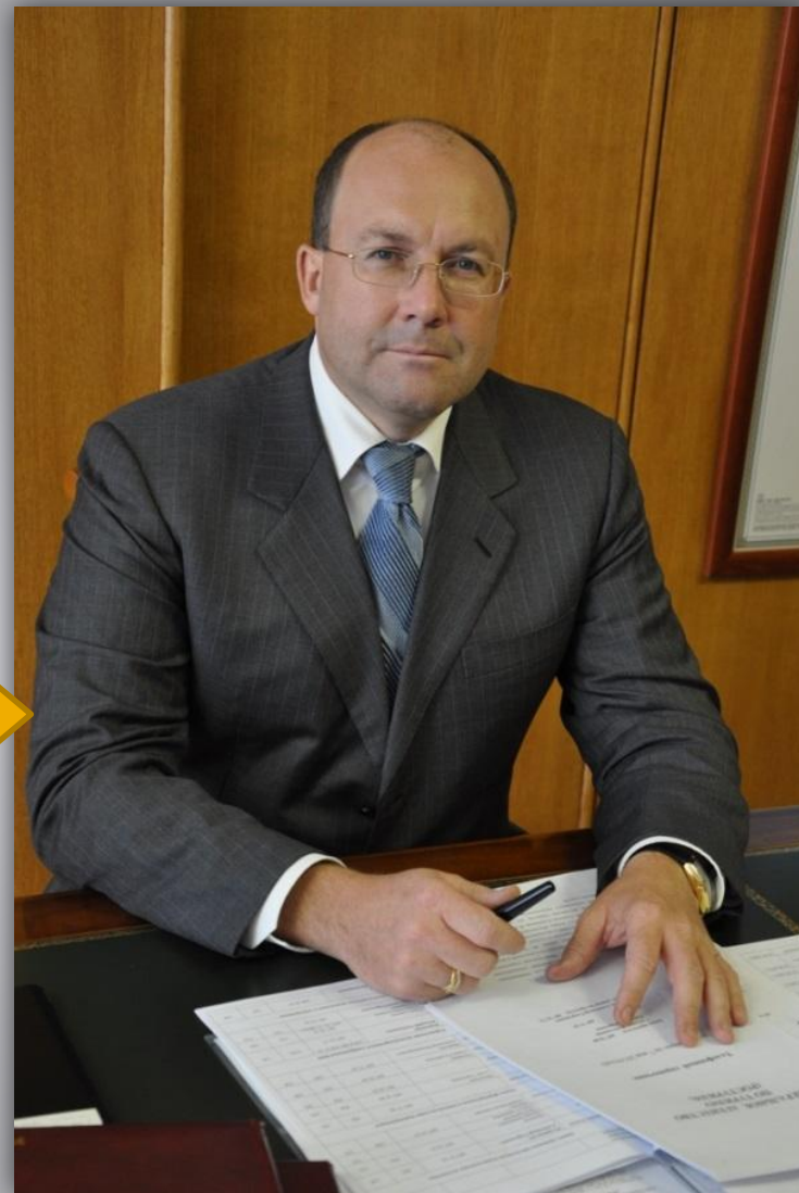
Олег Сафонов Глава Ростуризма

«Из-за навязанных ложных стереотипов и блокировки в западных СМИ позитивной информации о нашей стране у них занижен порог ожиданий, поэтому получается "WOW-эффект" .