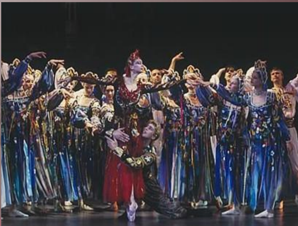
«Жар – птица»