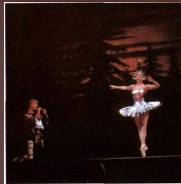
«Конек – горбунок»