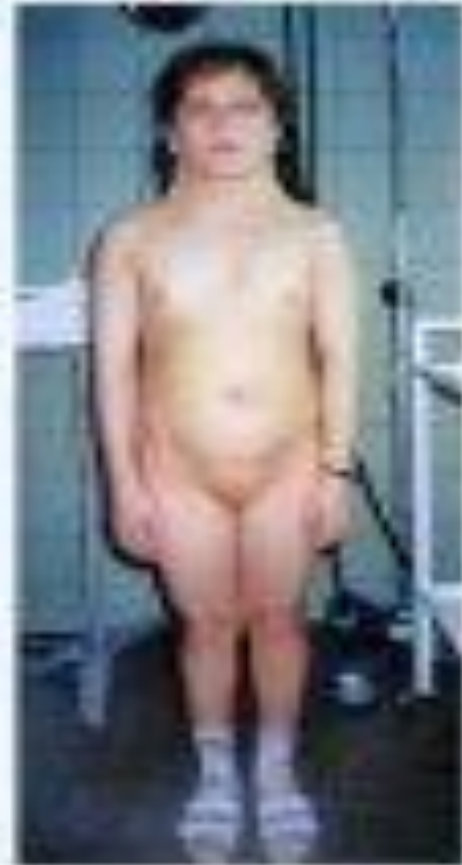
Рисунок 13. Восьмилетняя девочка с синдромом Шерешевского-Тарнера. Видна короткая шея, характерная для этого синдрома.