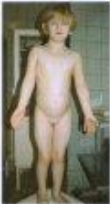
Рисунок 18. Восьмилетняя девочка с синдромом Шерешевского-Тарнера. Видна короткая шея, характерная для этого синдрома.