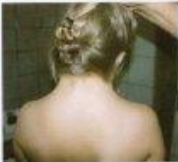
Рисунок 16. Восьмилетняя девочка с синдромом Шерешевского-Тарнера. Видна короткая шея, характерная для этого синдрома.